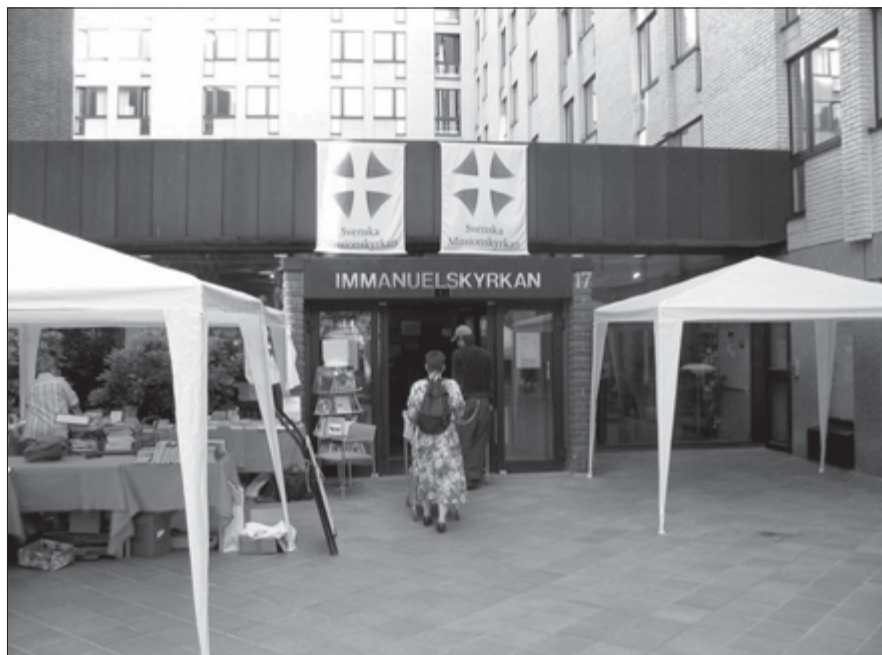
Įėjimas į bažnyčią, kur vyko švedų Sinodas.

Lietuvos evangelikų reformatų atstovas MCC generaliniame sinode lankėsi jau antrą kartą. Be Lietuvos atstovo buvo svečių iš partnerinių reformatų bažnyčių iš Europos bei Azijos, Afrikos, centrinės Amerikos šalių. Dauguma jų susiformavo aktyvios MCC misionieriškos veiklos 19 a.