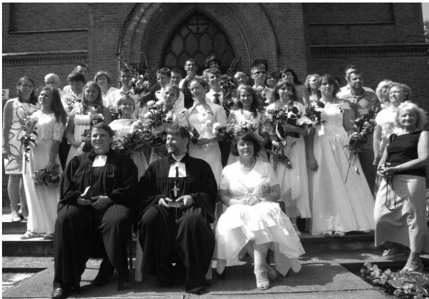
2010 m. konfirmacija Biržuose

Per 2010-uosius nemažai nuveikta tvarkant bažnyčios ir klebonijos, parapijos aplinką: sutvarkytas šulinys, uždengtas stogelis (apdailos darbai dar nebaigti), nudažytas parapijos medinis namas, klebonijoje baigta tvarkyti šiaurinė svetainė – svečių kambarys su dušo kabina ir WC, išdažytas parapijos namų verandos vidus. Už parapijos namų remontų projektus ir rūpestį juos prižiūrint esame dėkingi seniūnei Erikai Galvelytei. Taip pat baigtas bažnyčios bokštelių remontas.