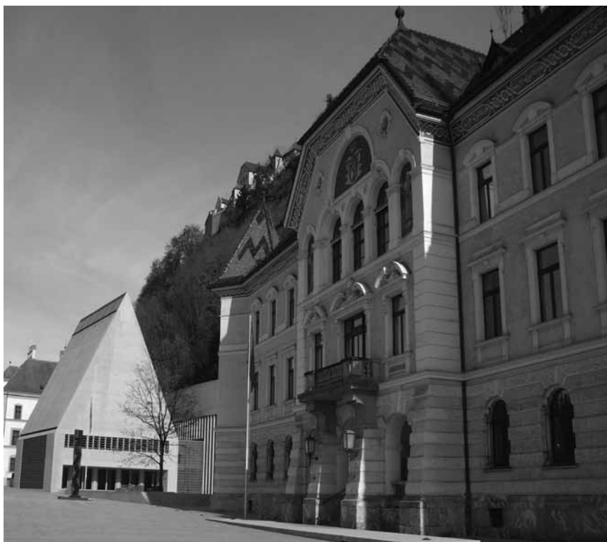
Lichtenšteino vyriausybės rūmai, už jų – mažos šalies mažas parlamentas, padangėje – Kunigaikščio pilis Vaduce

Šventė ir pirmasis koncertas buvo iš anksto išreklamuoti spaudoje ir per televiziją, todėl koncerte-pamaldose dalyvavo ir kitų konfesijų atstovų. Skambėjo klasikinė muzika – įžymių kompozitorių Telemano,