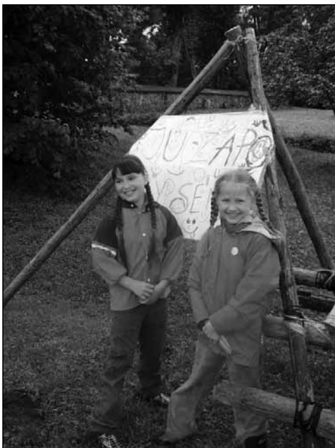
Šypsenu šypsenu stovykloje

Penkių dienų stovykla, kurią jau antrus metus iš eilės organizavo Biržų reformatų parapijos Jaunimo grupė, prabėgo it akimirksnis. Nei lietus, nei kiti išbandymai neištrynė šypsenu iš vaikų bei vadovų veidų.