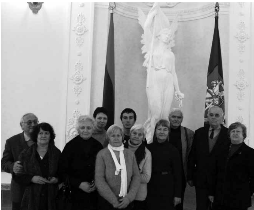
Reformatų senjorų draugijos nariai kartu su Vilniaus reformatų bendruomenės atstovais apsilankė Prezidentūroje