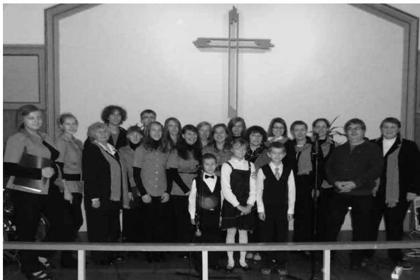
Biržų evangelikų reformatų parapijos choras SD Gloria Atvidabergo miestelio (Švedija) bažnyčioje

Kitą dieną aplankėme miestelio istorijos muziejų, dviejų bažnyčių įsteigtą labdaros krautuvėlę, kurios gautos lėšos panaudojamos įvairiems misijos projektams. Mažesnieji vaikai buvo be galo