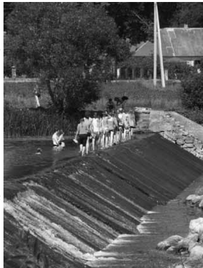
Pakeliui į bažnyčią