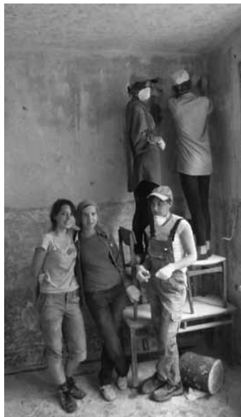
Darbo stovykla Nemunėlio Radviliškyje

Gruodžio 11 d. vyko Advento popietė, kurioje parapijos vaikai ir tėveliai bei kiti parapijiečiai gilinosi į Advento prasmę, pynė Advento vainikus, mokėsi gaminti šiaudinius eglutės žaisliukus, gamino kalėdinius atvirukus, vaikai kepė ir dekoravo kalėdinius sausainius. Jais buvo pavaišinti visi popietės svečiai.