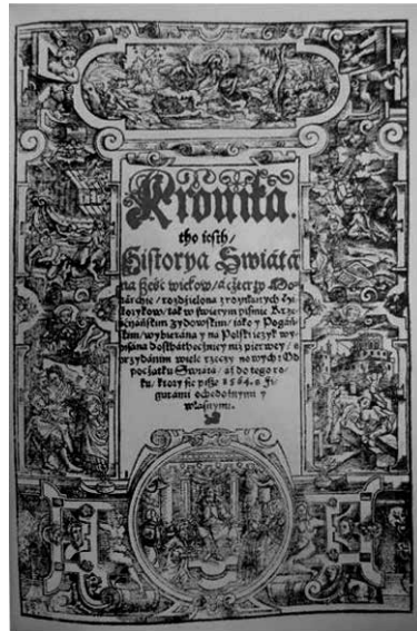
Kronika tho iesth Historya swiata

Pirmasis LDK pilietis, įtrauktas į Index librorum prohibitorum buvo