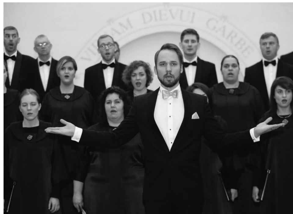
Solistas Jonas Sakalauskas ir Vilniaus valstybinis choras „Vilnius“