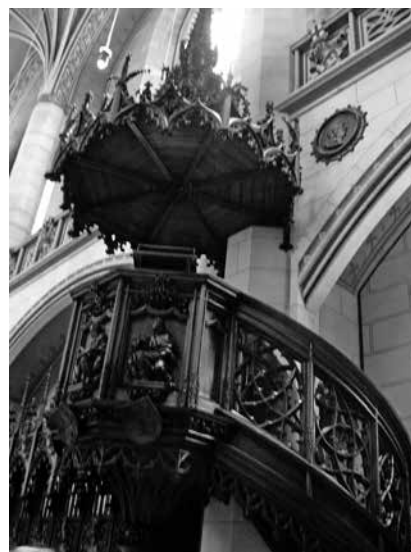
Šv. Andriejaus bažnyčios sakykla Eislebene, iš kurios 1546 m. vasario mėn. M. Liuteris pasakė paskutinius keturis savo pamokslus

Iš Martynas Liuteris UŽSTALĖS POKALBIAI, 2003