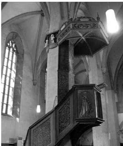
Vitenbergo pilies bažnyčios sakykla, iš kurios pamokslavo M. Liuteris