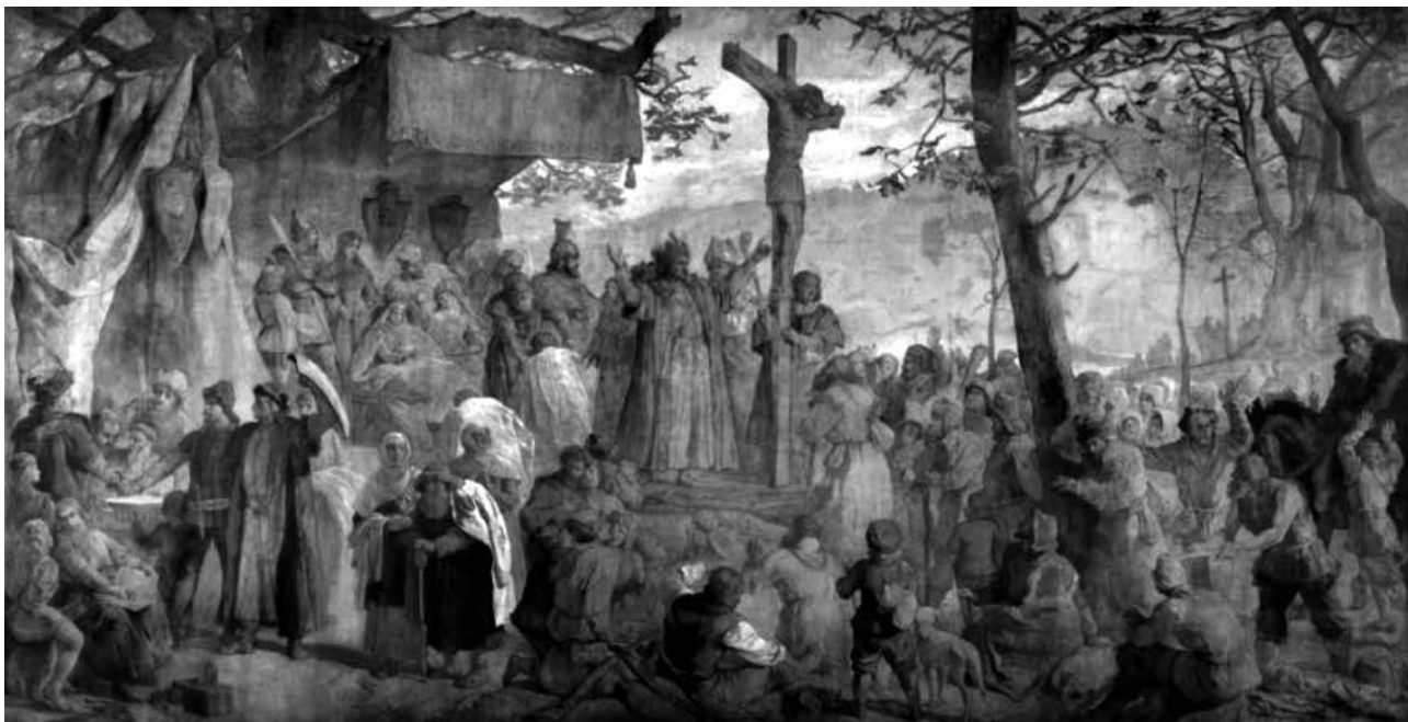
Wojciech Gerson paveikslas „Lietuvos krikštas“ 1889 m.