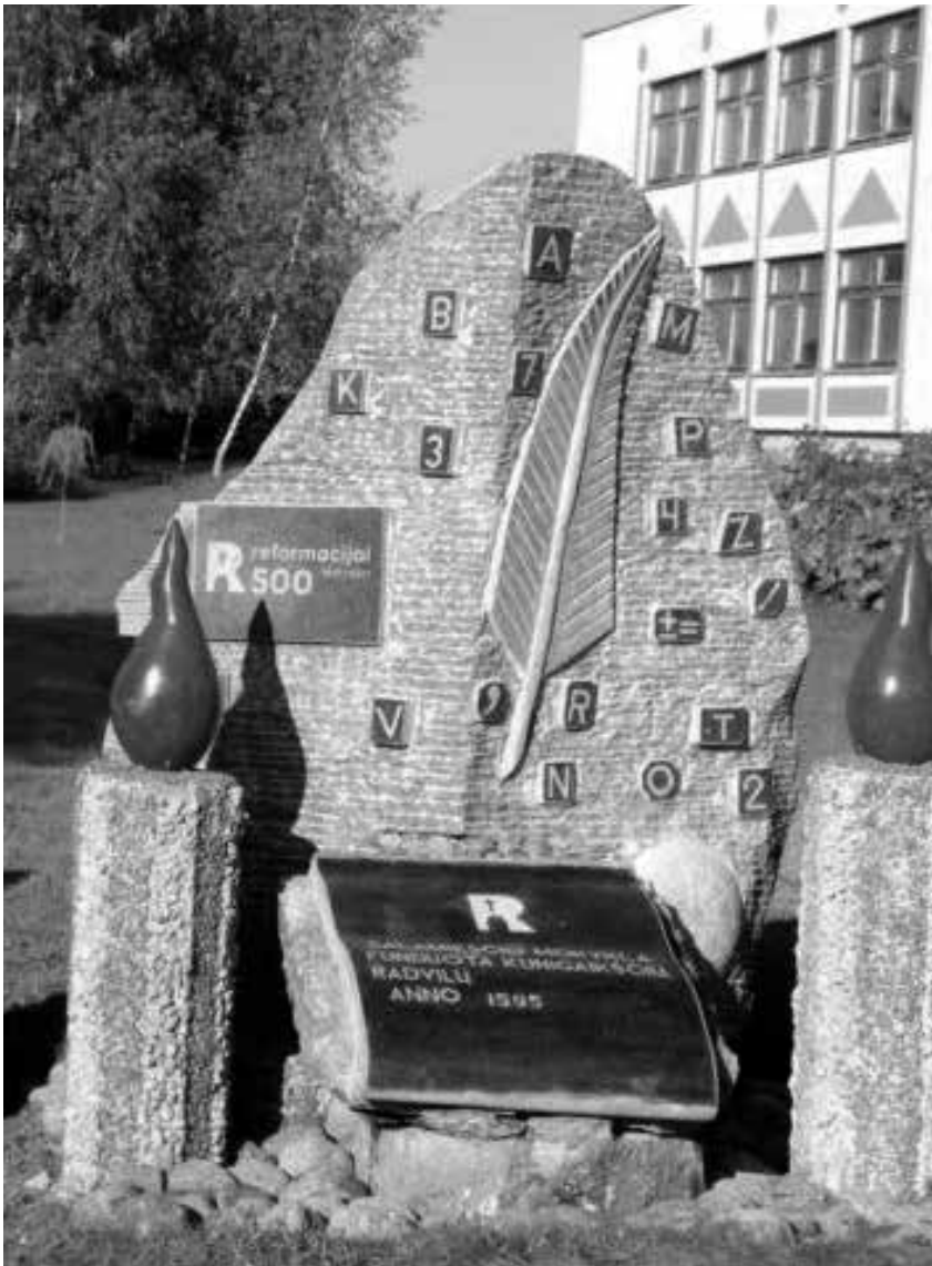
Paminklinis akmuo Salamiesčio mokyklai, įkurta 1595 metais

Spalio 6 d. senjorai apsilankė Valdovų rūmuose, kur atidaryta vieno išpūdingo ir turiningo eksponato paroda. Šis eksponatas – garsaus lenkų akademinės realistinės dailės kūrėjo Voicecho Gersono (Wojciech Gerson, 1831–1901) paveikslas Lietuvos krikštas , sukurtas 1889 metais, Lietuvos krikšto (1387 m.) 500 metų sukakčiai paminėti. Kūrinys išsiskiria monumentaliais matmenimis (beveik 4 x 7 m), reta monochromine tapyba, kompozicijos