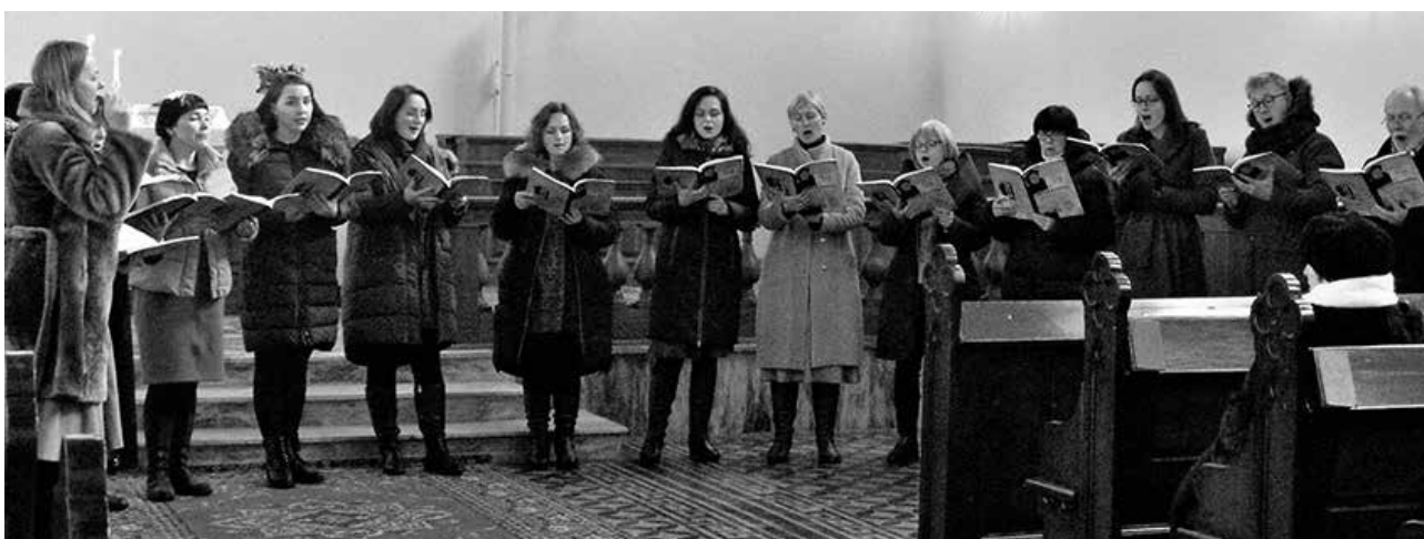
Gieda liuteronų bažnyčios choras ir ansamblis Adoremus