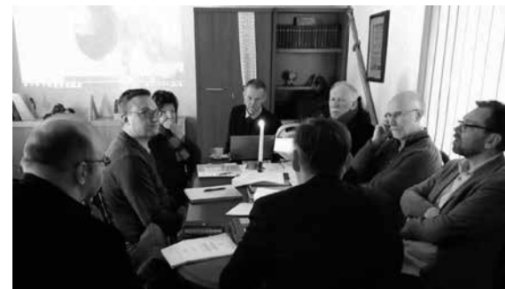
Konsistorijos posėdis Biržuose, 2018 03 18