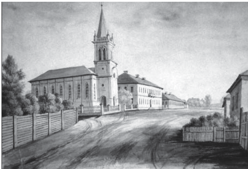
Slucko reformatų gimnazija. N. Ordos piešinys. XIX a.

1873 metais, baigęs institutą, jis buvo paskirtas klasikinių kalbų mokytoju į Charkovo gubernijos Sumų mieste esančią Aleksandro imperatoriškąją gimnaziją. Čia, toli nuo tėvynės, dirbo 21 metus. Gimnazistus