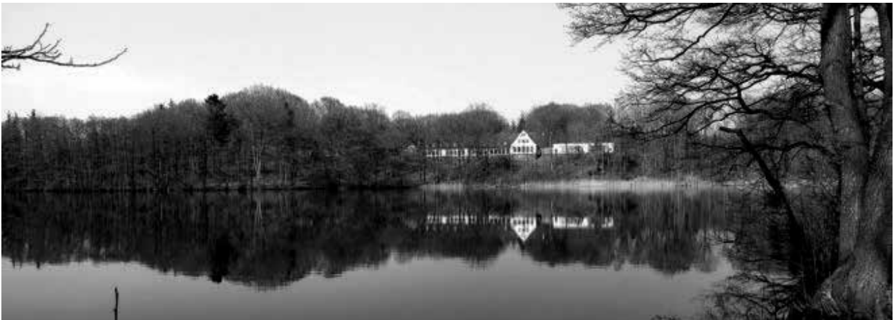
Sankelmarko akademija ne iš fasadinės pusės

Žinoma, pranešėjas nenutylėjo ir trumpalaikio mūsų istorijos kuriozo – sprendimo kurti monarchiją, derybų su Viurtenbergo kunigaikščių Wilhelmu von Urachu; šis 1918 m. liepos 11 d. paskelbtas Lietuvos karaliumi Mindaugu II, tačiau karaliaus nespėjus nė karūnuoti, lapkričio 2 d. Lietuvos Taryba šį sprendimą