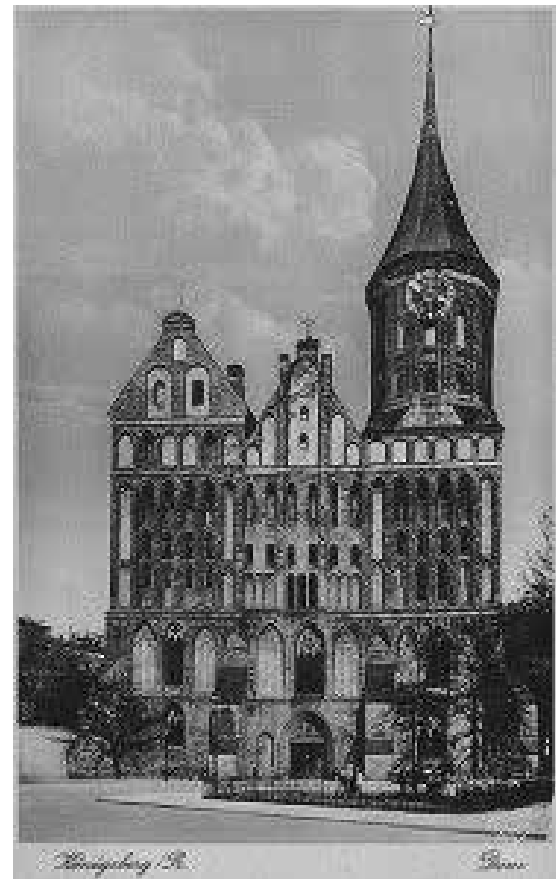
Karaliaučiaus katedra, per II pasaulinį karą sugriauta, dabar atstatyta