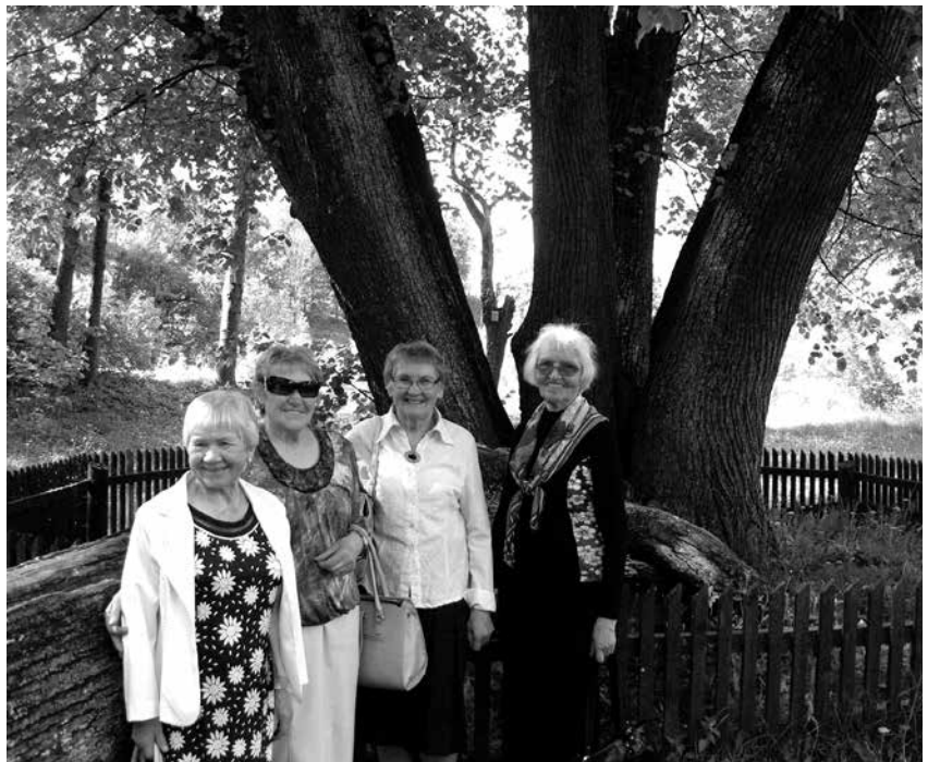
Prie septynkamienės liepos