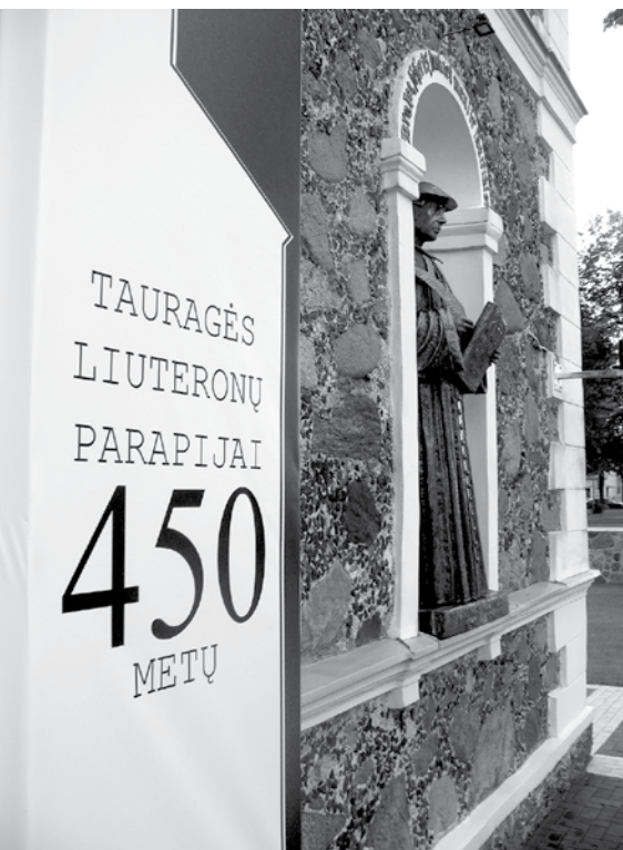
Martyno Mažvydo skulptūra Tauragės evangelikų liuteronų bažnyčios sienos nišoje, 2017 m.