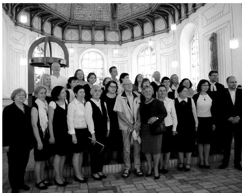
Vilniečiai po pamaldų su Pliono parapijos kunigu

Sekmadienį choristai giedojo Pliono Mikalojaus liuteronų bažnyčioje Šv. Trejybės šventės pamaldose su Krikšto sakramentu.