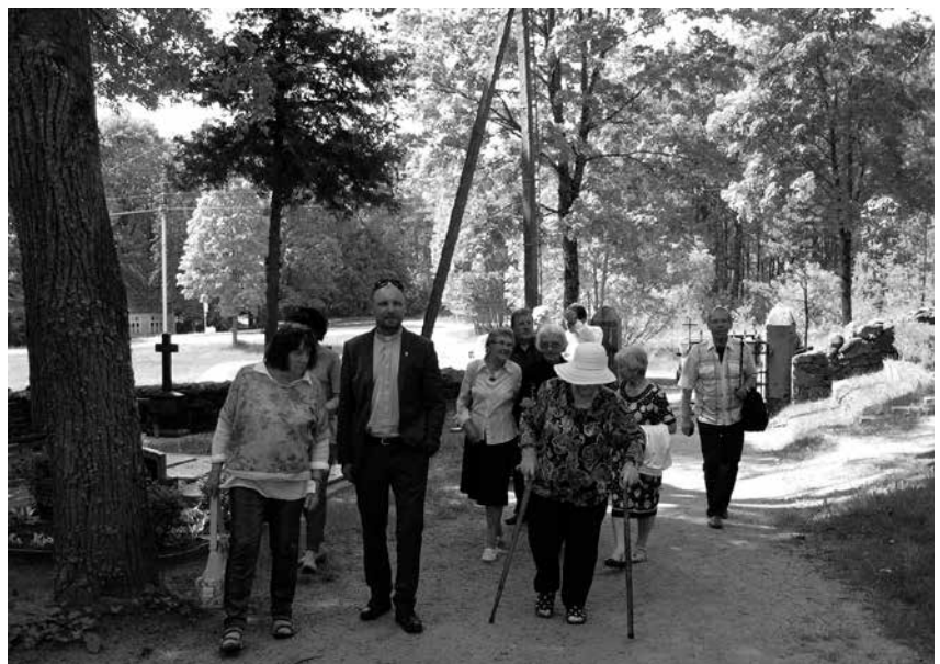
Panevėžiečiai aplankė Alkiškių ev. liuteronų bažnyčią