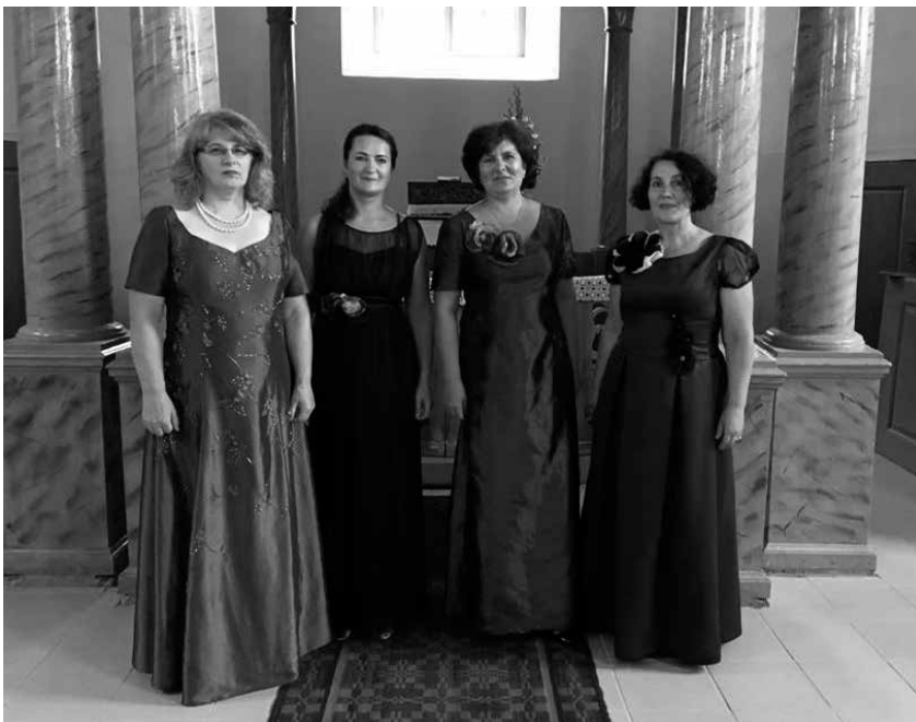
Papilio Kultūros centro moterų kvarteto Rovėjūnės