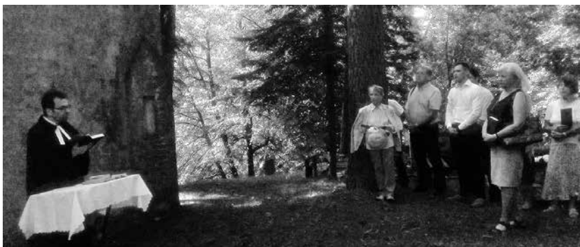
Kapų šventė Antavilių kapinėse

nisterijos, Policijos departamento prie Vidaus reikalų ministerijos ir Valstybės sienos apsaugos tarnybos prie Vidaus reikalų ministerijos atstovais.