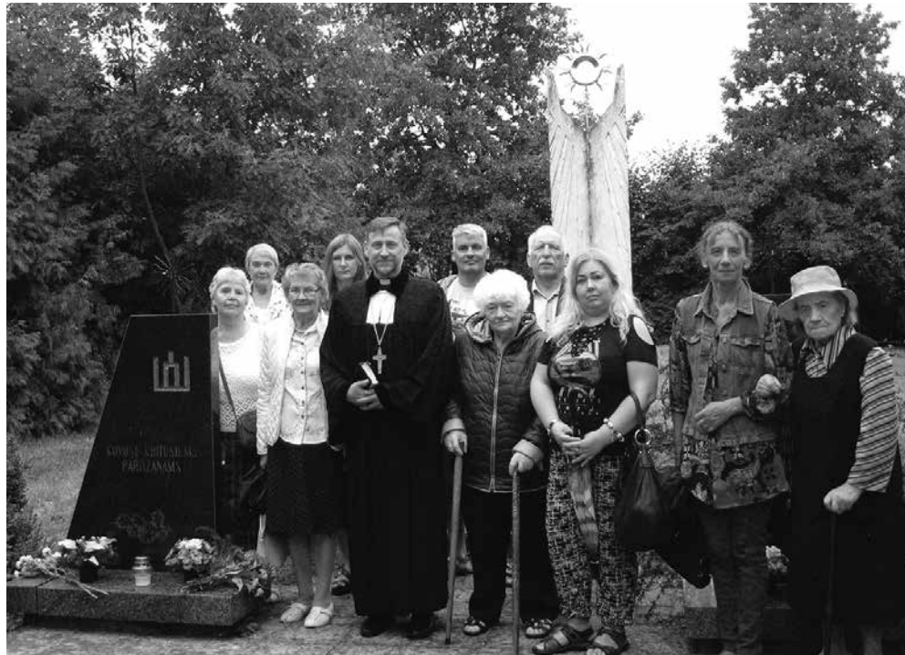
Panevėžiečiai prie paminklo Partizanams Papilyje