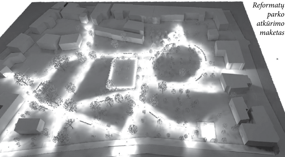
Reformatų parko atkūrimo maketas