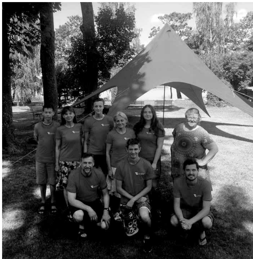
Biržų dieninės vaikų stovyklos vadovai

Liepos 30 d. Vilniaus evangelikų reformatų bažnyčioje vėl rinkosi vilniečiai į atminimo vakarą Budėkime dėl santarvės ir taikos , skirtą Medininkų tragedijos 27-osioms metinėms paminėti bei visiems taikos metu žuvusiems pareigūnams, kariams prisiminti. Kitą dieną prie Medininkų memorialo Tylos minute buvo pagerbti kritusieji už Lietuvos laisvę ir nepriklausomybę, buvo padėtos gėlės, sakomos kalbos. Medininkų tragedijos minėjimo renginiai buvo pratęsti Antakalnio kapinėse, kur palaidoti nužudyti pareigūnai. Po to žuvusiųjų pareigūnų artimieji buvo pakviesti pietums kartu su Vidaus reikalų ministerijos, Muitinės departamento prie Finansų mi-