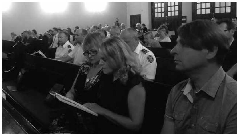
Atminimo vakaro Budėkime dėl santarvės ir taikos svečiai