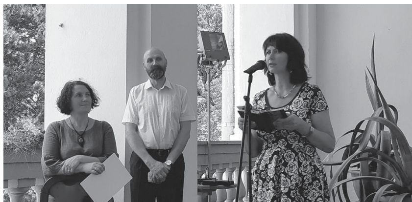
Savo favoritus apdovanojo Sėla muziejaus vadovai