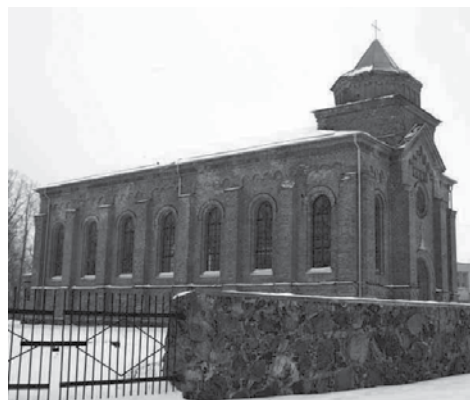
N. Radviliškio reformatų bažnyčia

1956 metais <...> vasarą buvau konfirмуota ev. reformatų bažnyčioje, nes prie Pirmosios Komunijos reformatai eina paauglystėje. Man tada buvo 15 metų. Šventė vykdavo