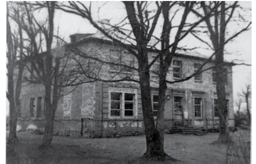
Buvusi Nem. Radviliškio klebonija, paskui vidurinė mokykla