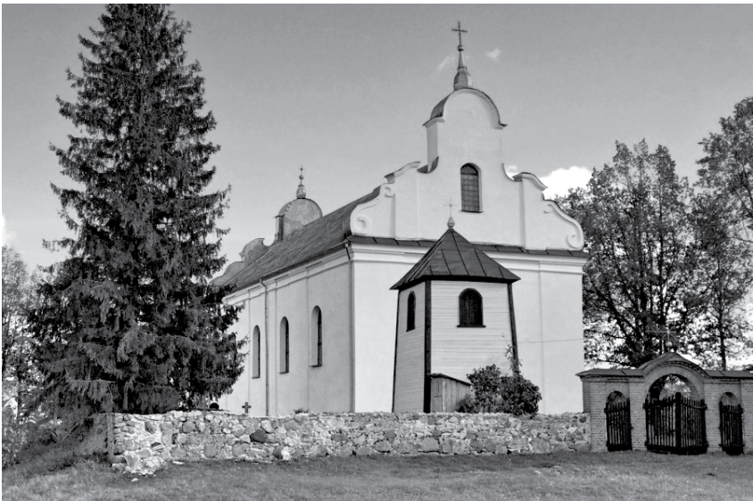
Švobiškio reformatų bažnyčia