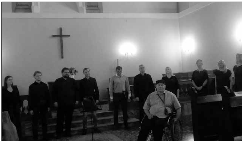
Ansamblis Draugiški projektai

Rugpjūčio 29 d. vakarą Kapinių šventei Antakalnio kapinėse rinkosi vilniečiai malda ir giesme prisiminti Amžinybėn išėjusius savo artimuosius, gimines, draugus.