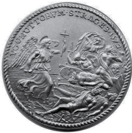
Medalis Grigaliaus XIII garbei, kurio reverse Hugenotų žudynės, 1572, rugpjūtis 23-24.

Hugenotai sustiprino savo valstybę valstybėje Pietų Prancūzijos citadėlėse. Galimas dalykas, kad Prancūzija būtų ilgesniam laikui įsivėlusį chaosą ir pilietinį karą, jei ne tokia asmenybė kaip Henrikas Navarietis. 1576 metais jis pabėgo iš karaliaus rūmų ir nuo to laiko atkakliai vadovavo protestantams. Tačiau Henrikas nesirengė keršyti katalikams. Visų pirma jis jautėsi esąs prancūzas ir jam rūpėjo visos šalies gerovė. Jau 1576-aisiais, dar būdamas 23 metų, jis sakė: Mes visi esame prancūzai ir tos pačios tėvynės piliečiai. Todėl privalome savo nesantaiką išspręsti protu, o ne griežtumu ir žiaurumu, kurie tinka tik žmonėms kiršinti.