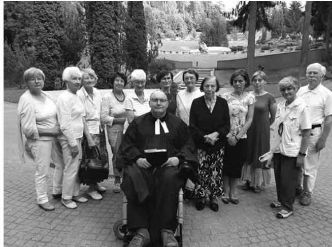
Vilniečiai Kapų šventėje