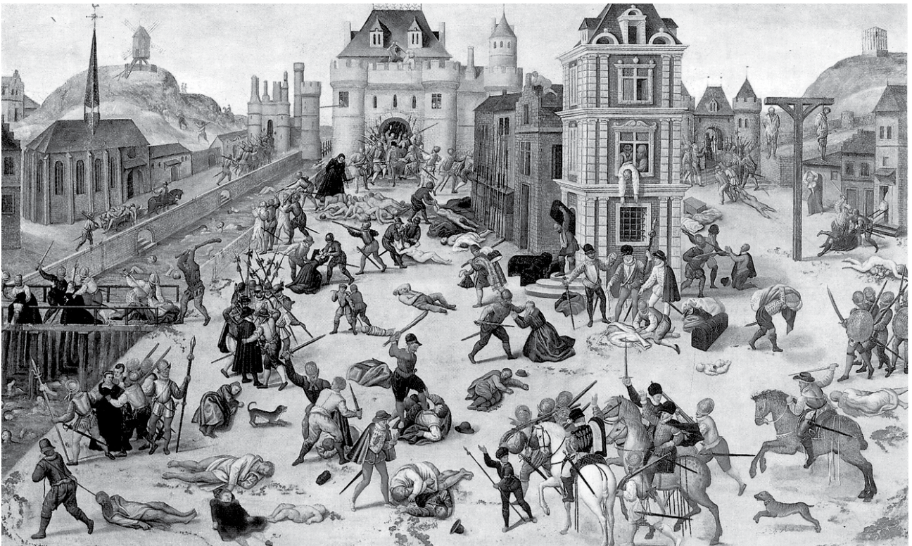
Baltramiejaus naktis. François Dubois paveikslas, XIX amžius