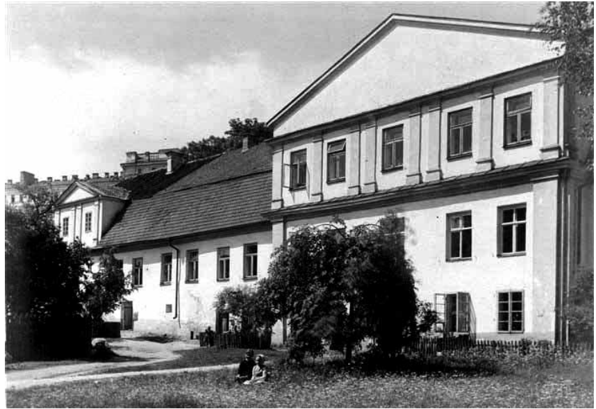
Reformatų sinodo rūmai. XX a. III-io dešimtmečio fotografija.

Seniausias pastato statybos etapas priskiriamas XVI amžiui. Šiuo pirminiu laikotarpiu tai buvo dviejų aukštų namas (esamo pastato piet-