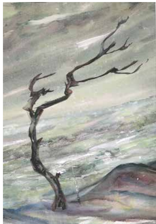
Akvarelė (metai nepažymėti)