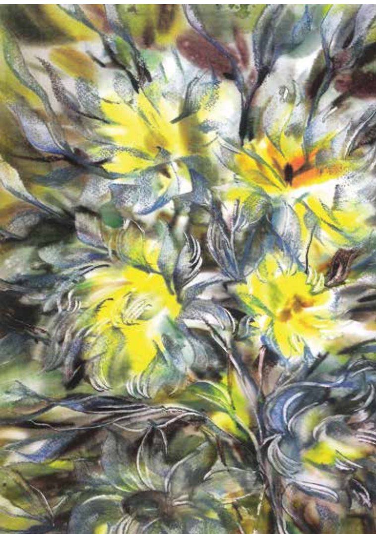
Akvarelė, 1969 m.