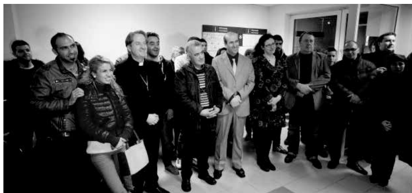
Svečių sutikimas Šiauliuose

Parengta pagal informaciją žiniasklaidoje