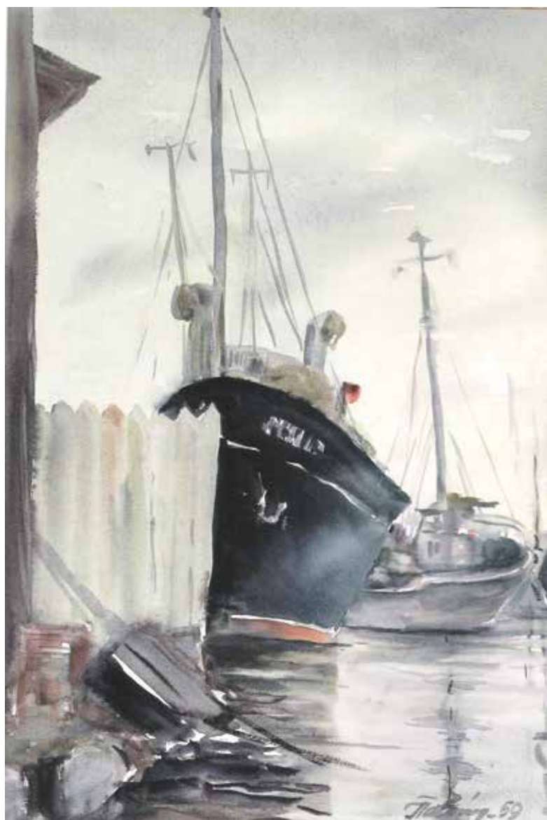
Akvarelė, 1959 m