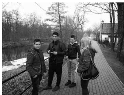
Svečiai iš karo niokojamos Sirijos Šilutėje

Sirijoje vyksta žiaurūs teroro aktai, bauginami, žudomi kitatikiai. Čia per pilietinį karą jau žuvo per 130 tūkst. žmonių. Konfliktas prasidėjo