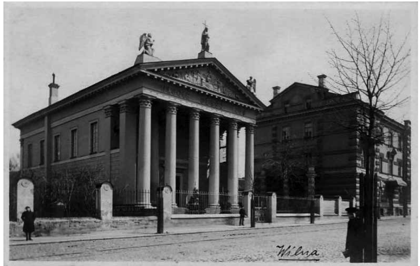
Vilniaus Reformatų bažnyčia apie 1925–1939 m.