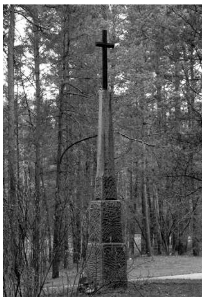
Paminklas Paneriuose žuvusiems lietuviams atminti

1989 m. lenkų visuomeninės organizacijos savo lėšomis pastatė kryžių ir paminklą žuvusiems lenkams.