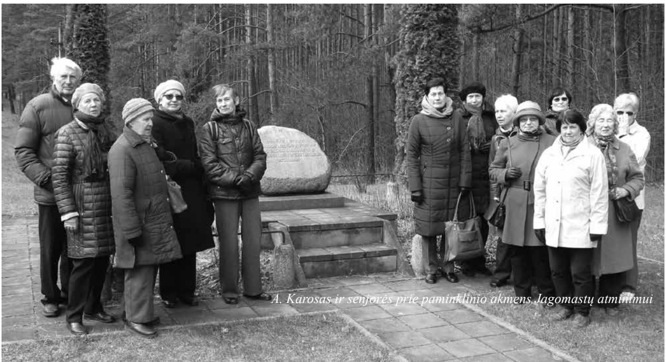
A. Karosas ir senjorės prie paminklinio akmens. Jagomastų atmintimui

1991 m. I. Epšteino iniciatyva priešais obeliską pastatytas antras paminklas – nužudytiems žydams atminti (jam I. Epšteinas paaukojo 90 000 rublių).