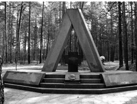
Paminklas sušaudytiems Vietinės rinktinės kariams