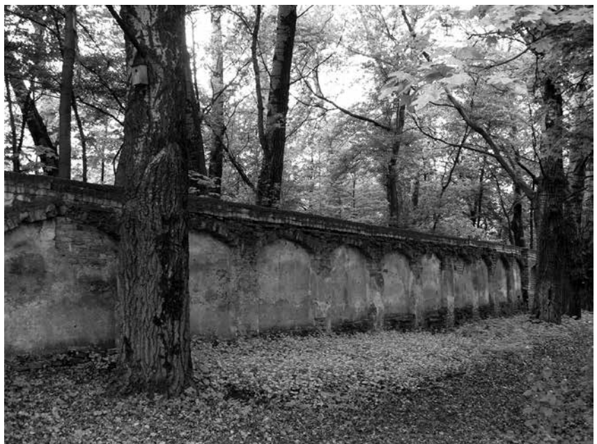
XVII a. Jėzuitų Lukiškių tvora-siena