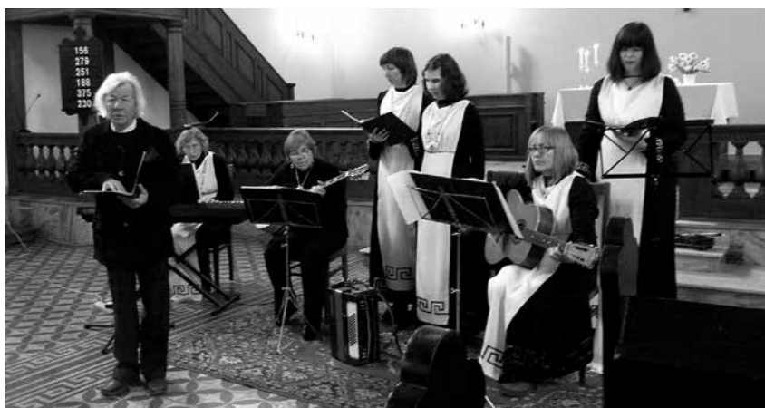
Lietuvos graikų ansamblis „Patrida“

Po Motinos dienai skirto koncerto neskubėjome skirstytis, dar mielai pabendravome agapėje prie arbatos puodelio, apimti įstabios bendrystės jausmo.