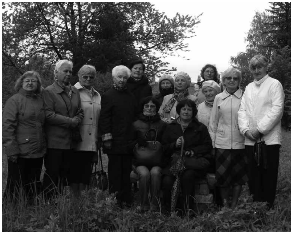
Senjorės ant Mikalojaus Radvilos Juodojo buv. rūmų pamatų