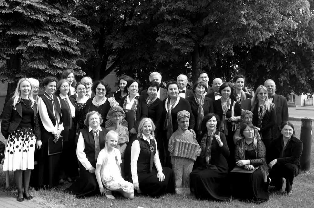
Vilniaus reformatų „Giesmės“ ir „Pagirių dainorių“ jungtinis choras