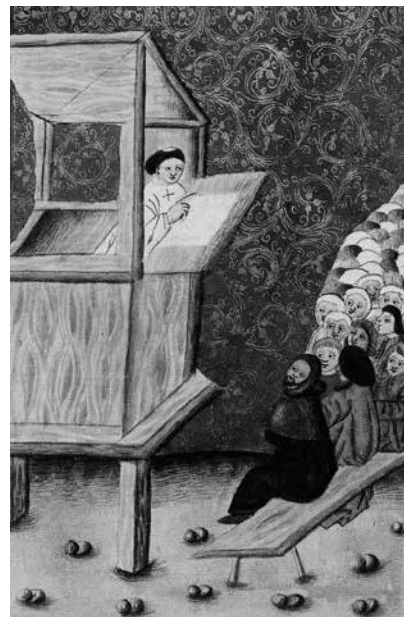
Janas Husas sako pamokslą. 1490 m. iliustracija

Tikėjimas, išvystytas mylint, yra Bažnyčios pamatas, nes per tikėjimą Bažnyčia yra pastatyta ant Uolos, Jėzaus Kristaus, ir per tikėjimą Bažnyčia išpažįsta Jį tuo esant. Petras kalbėjo visų tikinčiųjų vardu, kai sakė: „Tu esi Kristus, gyvojo Dievo Sūnus“. „Ir štai pergalė“, – rašė Jonas, – nugalinti pasaulį: mūsų tikėjimas! O kas gi nugalį pasaulį, jei ne tas, kuris tiki, kad Jėzus yra Dievo Sūnus?“ /1 Jn 5,5/<...>.