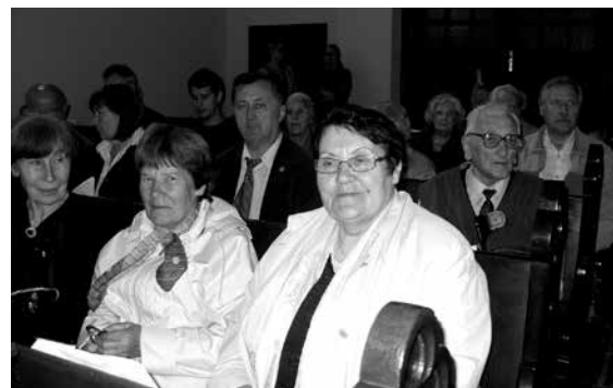
Viešnios iš Biržų

Sugiedojus Lietuvos Respublikos himną susirinkusieji neskubėjo skirstytis ir džiaugėsi, kad jau antrus metus Lietuvos evangelikų reformatų