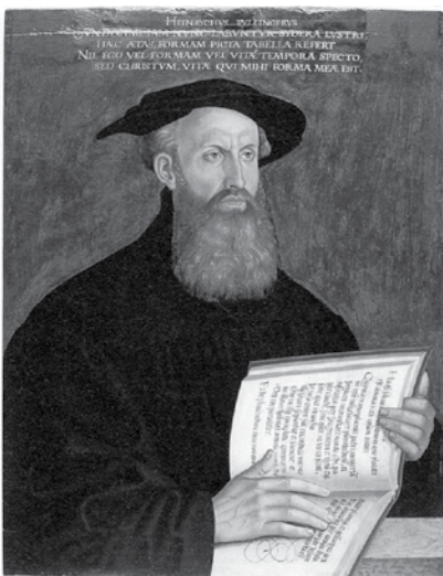
HEINRICHAS BULINGERIS Heinrich Bullinger (1504–1575)