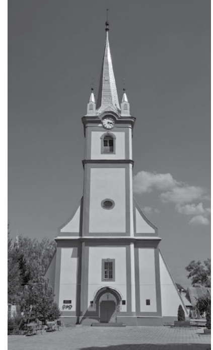
Reformatų bažnyčia Tiačeve, pastatyta 1748 m., renovuota 1985 m.