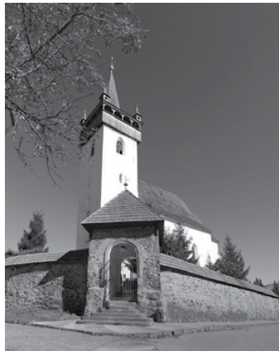
Reformatų bažnyčia Chuste