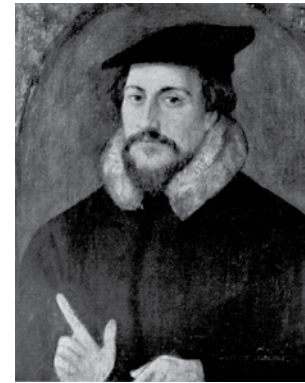
JONAS KALVINAS Johannes Calvin (1509–1564)

Martynas Buceris buvo Strasbūro ir viso Elzaso reformatoriumi. Jis asmeniškai diskutavo su Liuteriu Heidelberge 1518 metais, o vėliau patarinėjo Pfalco žemės grafiui, Viurtembergo hercogui bei Heseno žemės grafiui. Tarpininkavo susipriešinusioms reformatų stovykloms ir siekė sutarimo su katalikais. Taip pat nusipelnė kuriant bendruomenę ir sielovadą. Pagrindė kelią konfirmacijai. Turėjo didelę įtaką Kalvinui, kurį laiką gyvenusiam Strasbūre. Emigravo į Angliją ir ten mirė 1551 metais.