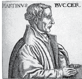
MARTYNAS BUCERIS Martin Bucer (1491–1551)

Katalikų kunigas, kuris 1523 metais Ciuriche įvedė Reformaciją ir kuris prieš metus (1522) didžiai visus nustebino tuo, jog nedraudė valgyti dešros pasninko metu. Savo pozicijoje jis buvo nuoseklesnis nei Liuteris. 1529 metais religinėje Marburgo diskusijoje su Liuteriu jam nepavyko pasiekti vienybės. Visa, kas nebuvo kilę iš Biblijos ar Dievo Žodžio, jis radikaliam šalino iš Bažnyčios. Reformatoriškos krypties Šveicarijoje pagrindėjas. Cvinglis žuvo netoli Kappel am Albis miestelio mūšyje, kurį evangelikai pralaimėjo kovodami su katalikiškaisiais kantonais.