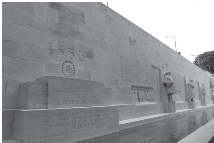
Kairėje nuo centrinės figūrų grupės