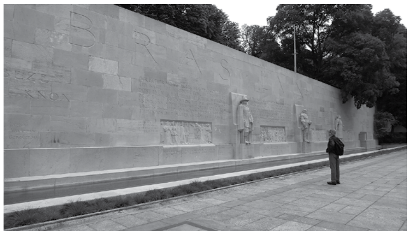
Dešinėje nuo centrinės figūrų grupės

► Prieš skulptūras užrašas senąja vokiečių kalba: Potsdamo įsakas (ediktas) 1685.10.29 leido prancūzų tautos tikėjimo bendraminčiams atvykti į kunigaikščio (vieno iš septynių turėjusių teisę rinkti Vokietijos kaizerį) Frydricho Vilhelmo Brandenburgo kraštą. Pats kunigaikštis – priešingai nei Brandenburgo krašto evangelikų liuteronų gyventojų dauguma – būdamas kalvinistų tikėjimo, pasiūlė savo tikėjimo bendraminčiams Prancūzi-