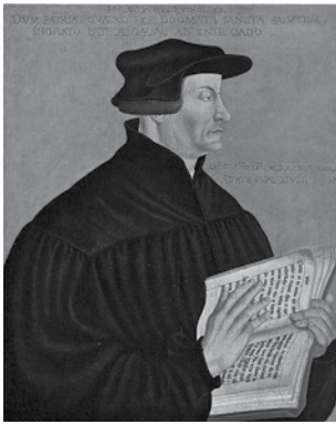
ULRYCHAS CVINGLIS Huldrych Zwingli (1484–1531)

Katalikų kunigas, kuris 1523 metais Ciuriche įvedė Reformaciją ir kuris prieš metus (1522) didžiai visus nustebino tuo, jog nedraudė valgyti dešros pasninko metu. Savo pozicijoje jis buvo nuoseklesnis nei Liuteris. 1529 metais religinėje Marburgo diskusijoje su Liuteriu jam nepavyko pasiekti vienybės. Visa, kas nebuvo kilę iš Biblijos ar Dievo Žodžio, jis radikaliam šalino iš Bažnyčios. Reformatoriškos krypties Šveicarijoje pagrindėjas. Cvinglis žuvo netoli Kappel am Albis miestelio mūšyje, kurį evangelikai pralaimėjo kovodami su katalikiškaisiais kantonais.