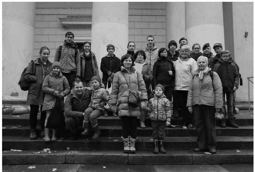
Talkininkai prieš išvykstant