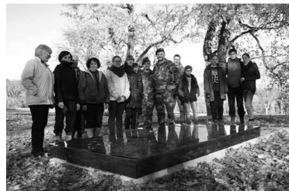
Po žygio ant Dubingių piliakalnio