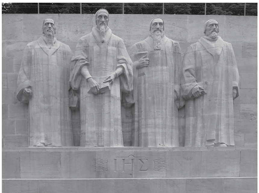
Sienos centre iš kairės Viljamo Fareljo, Jono Kalvino, Teodoro Beza ir Džono Nokso skulptūros

Kairėje nuo centrinės figūrų grupės sienoje iškalta trijų metrų skulptūros, įkūnijusios olandų princą Viljamą I Oranietį (Tylųjį), prancūzų hugenotą generolą Gasparą de Kolinį ir Frydrichą Vilhelmą – Prūsijos imperijos didįjį kurfiurstą, hercogą, Brandenburgo markgrafą. ▶