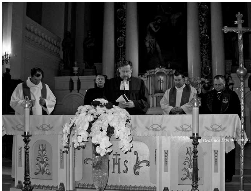
Ekumeninės maldos Biržų katalikų Šv. Jono Krikštytojo bažnyčioje