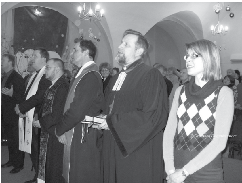
Pamaldos Sekmininkų bendruomenės bažnyčioje