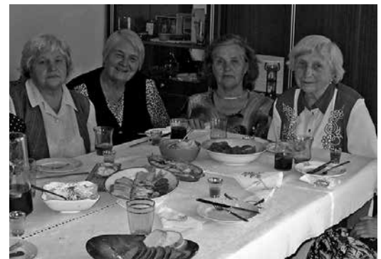
Švenčiant 80-metį su draugėmis