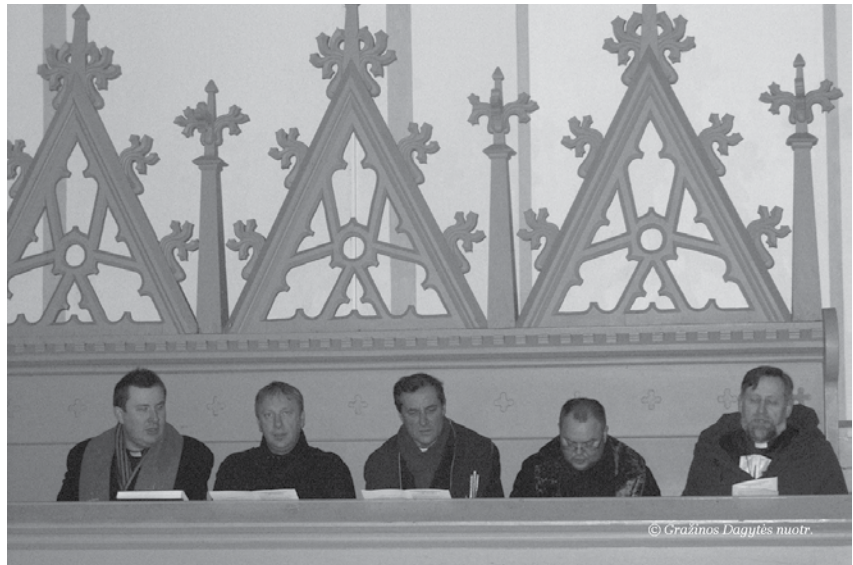
Ekumeninės pamaldos Biržų evangelikų reformatų bažnyčioje

Kunigas papasakojo apie Vatikano muziejuje esančią skulptūrą, kurioje vaizduojamas prie kryžiaus