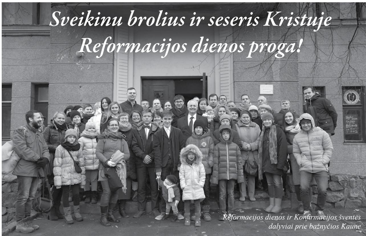
Rėformacijos dienos ir Konfirmacijos šventės dalyviai prie bažnyčios Kaune