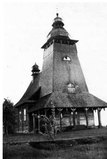
Buvusi Arnionių dvaro koplyčia