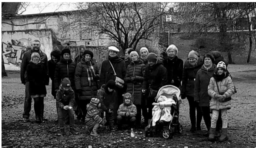
Amžinybės sekmadienį vilniečiai po pamaldų Pylimo g. skvere

Lapkričio 11 d. Užsienio reikalų ministerija į Valdovų rūmus buvo sukvietai visų Lietuvos pagrindinių religijų dvasininkus ir įvairių