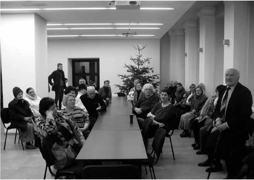
Danieliaus Kleino 350-ųjų mirties metinių minėjimas