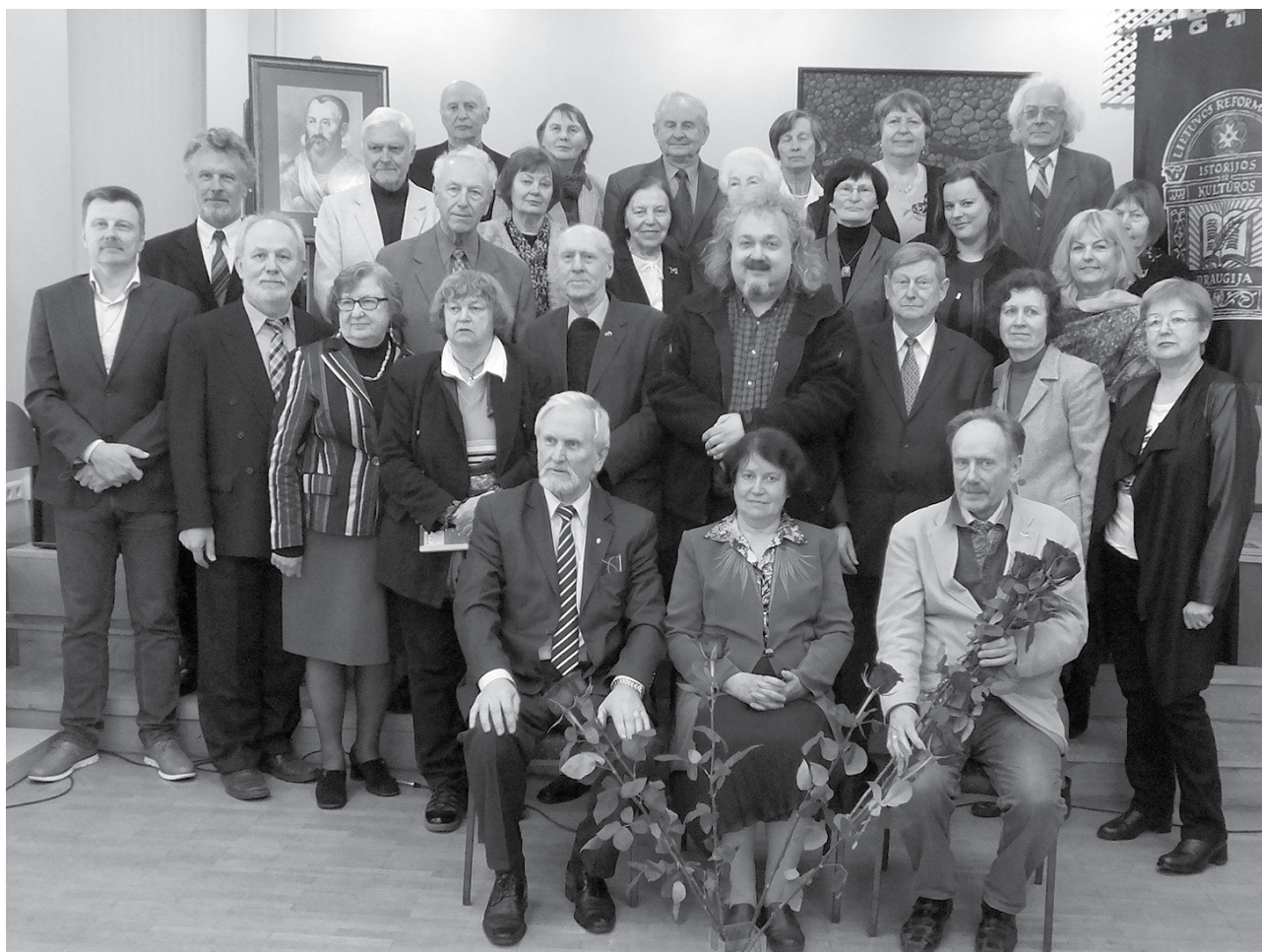
Reformacijos istorijos ir kultūros draugijos IX suvažiavimo dalyviai