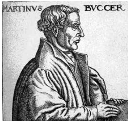
Strasbūro reformatorius Martynas Buceris – Evangelikų Konfirmacijos pagrindėjas

„Bažnyčių vyresnieji ir kunigai privalo sudaryti sąlygas ir gerai prižiūrėti, kad visi vaikai, sulaukę tinkamo amžiaus, būtų pasiūsti mokytis katekizmo. Mat katekizmo pamokas visur reikia taip išdėstyti, kad kiekvienas savo vaikus be jokio apsunkinimo į jas atvesti galėtų... Bažnyčių vyresnieji ir pamokslininkai turi pasirūpinti, kad vaikai katekizmo išmoktų tiek, jog juos ramia sąžine būtų galima leisti Šventosios Vakarienės. Tačiau prieš tai juos tėvų bei krikštatėvių pristatant kunigui visos bažnyčios akivaizdoje, tam skirtoje vietoje, per kurią nors didžiąją šventę – Velykas, Sekmines ar Kalėdas. Bažnyčios vyresnieji bei visi Žodžio tarnautojai turi stovėti išsirikiavę aplink kunigą, kai jis klausinės vaikus svarbiausių krikščioniškojo tikėjimo tiesų. Vaikams atsakius į visus klausimus bei viešai išpažinus savo priklausymą Kristui kaip Viešpačiui ir savo Bažnyčiai, kunigas turi pakviesti visą bažnyčią maldoje paprašyti Viešpaties šiems vaikams suteikti tikėjimo pastovumo