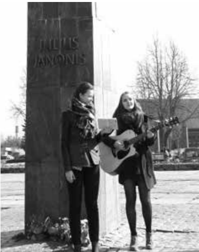
Balandžio 4 d. prie paminklo J. Janoniui biržiečiai skaitė poeto eiles