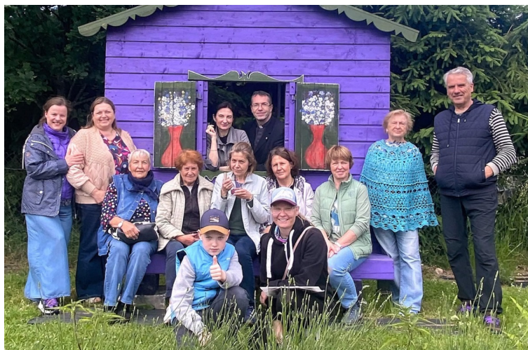
Kai kurie stovyklos dalyviai Levandų uoste

Dovydui. Biblijoje yra įvairaus turinio psalmių – Dievo šlovavimo, padėkos, skundo, atgailos, maldos, gedulo, prašysčių. Nemažai psalmių buvo giedamos per pamaldas šventykloje, kitos – Izraelio tautos tremties laikais. Dalis psalmių išreiškia Izraelio tautos tikėjimą, kitos – labai individualios ir asmeniškos. Visas žmogaus gyvenimas yra susietas su psalmėmis.