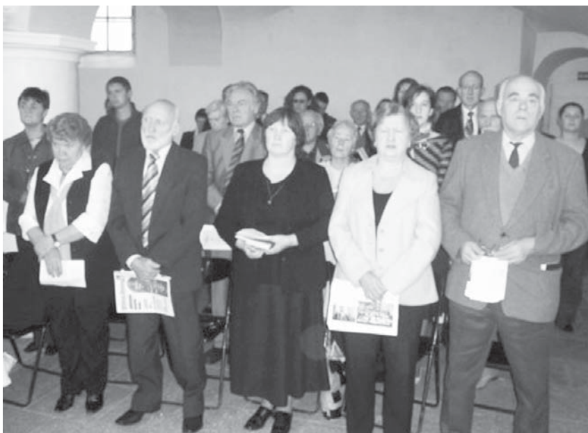
Vilniaus ev.liuteronų bažnyčios 450 metų jubiliejinėse pamaldose