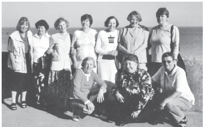
Forumo dalyvės prie jūros Zelenogradske

Rugsėjo 8-12 dienomis Sankt Peterburge vyko kitas Europos krikščionių moterų ekumeninio forumo renginys „Už feminizmo ribos: vyrai ir moterys