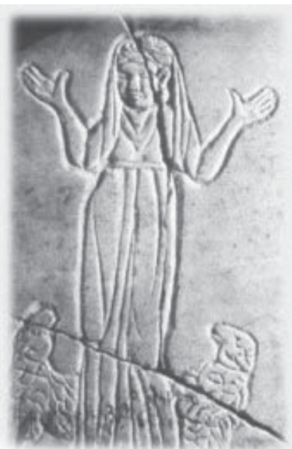
Moteris krikščionė pavaizduota romėnų