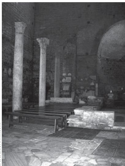
Domitilos katakombos ankstyvųjų krikščionių susirinkimų vieta