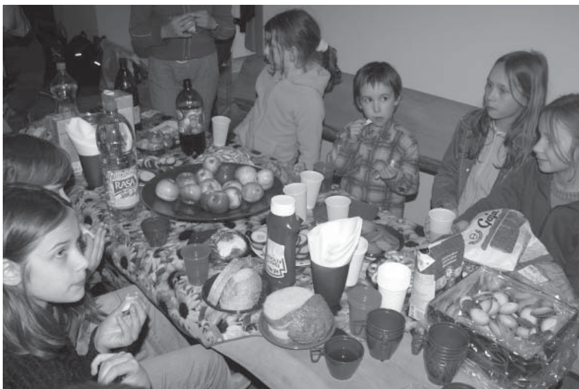
Sekmadieninės mokyklėlės uždarymas

■ Biržų savivaldybė iš 2006 metų vaikų ir jaunimo socializacijai skirtų lėšų paskyrė Vaikų poilsio programoms vykdyti viešajai įstaiagai „Vaiko užuovėja“ ir LERJD „Radvila“ po 2000 Lt.