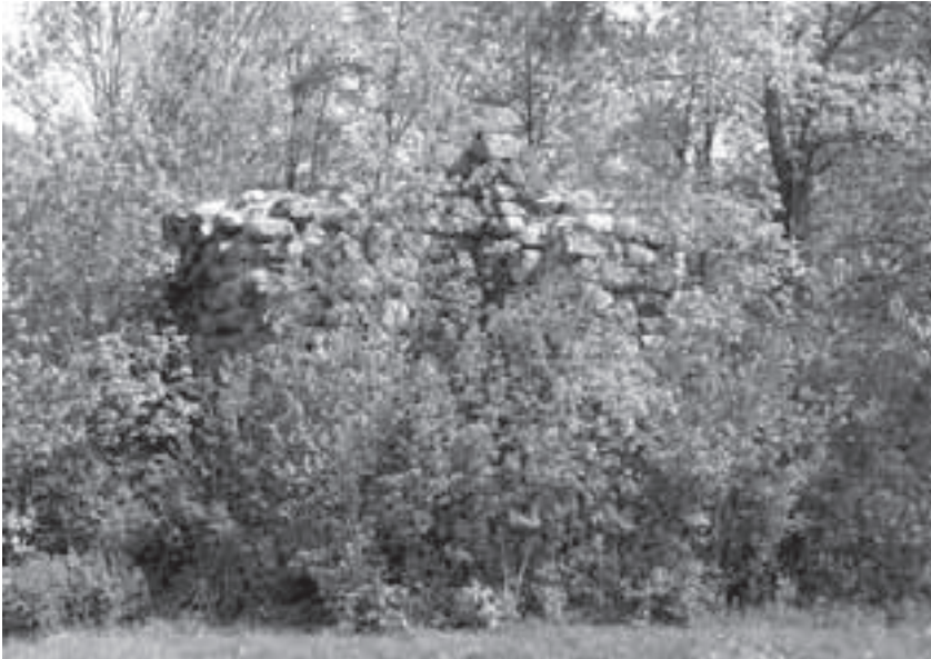
Griežės reformatų bažnyčios griuvėsiai

Išsivijęs lietuvių reformatų 1975 metų birželio mėn. žurnale „Mūsų sparnai“ Nr. 38 buvo atspausdinta 1940 m. daryta nuotrauka: Mažeikių šauliai Griežės reformatų bažnyčios griuvėsių fone.