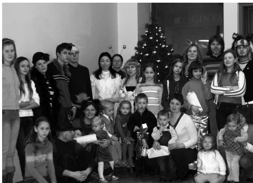
2006 m. gruodžio 28 d. Signatarų namuose Vilniaus jaunieji reformatai džiaugėsi Kalėdų eglute