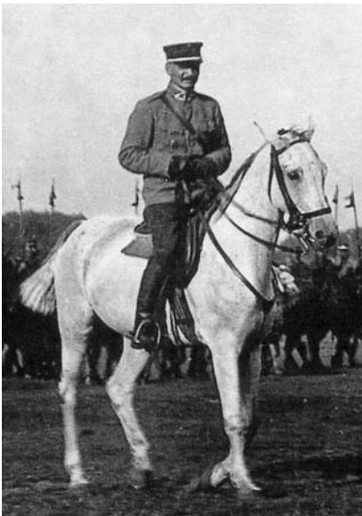
Pirmasis kariuomenės vadas gen. S. Žukauskas raitelių pulke 1919 m.

„Dvidešimtojo amžiaus Lietuvos istorijos lakštuose generolo Silvestro Žukausko asmenybė paliko neišdildomą pėdsaką, kuris visada spindės nelyginant pirmojo ryškumo žvaigždė. Jam teko būti istorinių įvykių, kurie lėmė jaunos Respublikos likimą, sukuryje, - pristatydamas knygą sakė autorius. – Jis vadovavo Lietuvos kariuomenei, kuri sunkiose kovose apgynė nelengvai iškovotą šalies nepriklausomybę“. Vakare buvo kalbėta apie Silvestro Žukausko gyvenimą, kurį likimas padalino į du tarpsnius: pirmasis – tarnyba Rusijos imperijos ka-