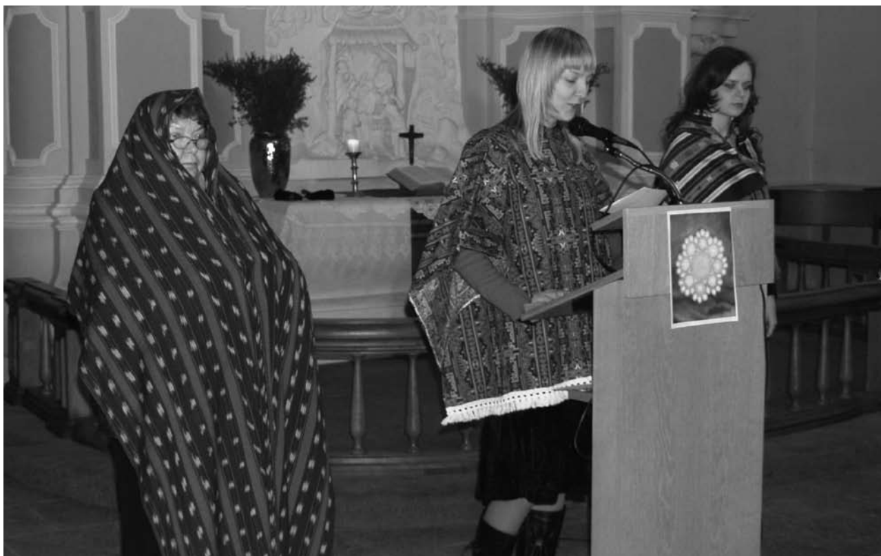
Apie Pietų Amerikos šalies moterų dalį pasakojo sesės liuteronės, tą vakarą tapusios paragvajietėmis.