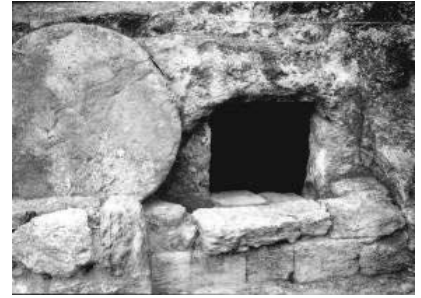
Ar tai tikrasis Jėzaus kapas?

Žurnalistai, rašydami apie Jėzaus vaiko palaikus, nepasivargina netgi korektūros patikrinti. Ar pasidomėjome, kodėl Marijos Magdalietės vardas ant tų radinių užrašytas graikiškai?