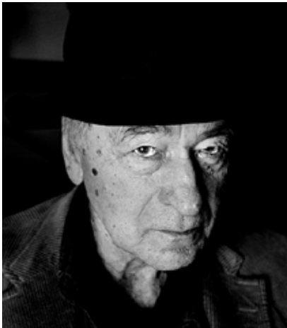
Jonas Mekas. 1998 m.

Kasdien naują trumpametražį filmą galima pasižiūrėti Jono Meko internetinėje svetainėje www.jonasmekas.com .