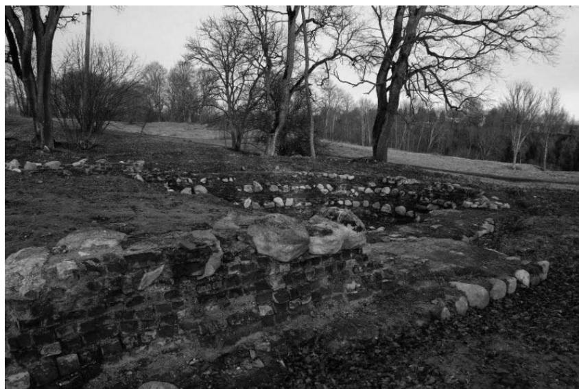
Evangelikų reformatų bažnyčios, kuri turėjo tapti giminės mauzoliejumi, liekanos Dubingiuose. www.wikipedia.lt