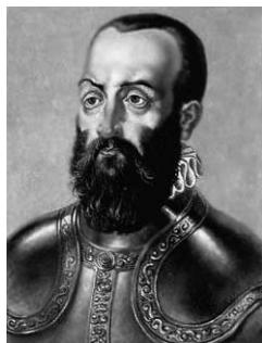
Mikalojaus Radvila Juodasis (1515–1565)