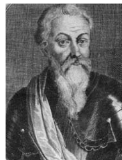
Mikalojus Radvila Rudasis (1512–1584)

Mykolo Romerio ir Vroclavo universitetų teismo medicinos ekspertų atlikti DNR tyrimai patvirtino archeologų spėjimus, kad Dubingiuose rasti LDK kunigaikščių Mikalojaus Radvilos Rudojo, Mikalojaus Radvilo Juodojo ir jų artimųjų palaikai.