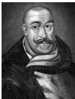
Kristupas II Radvila (1585–1640)