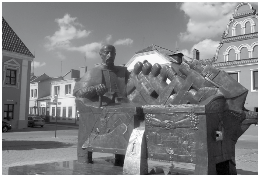
Jonušo Radvilos paminklą dėkingi kėdainiečiai iškėlė istorinėje miesto Didžiojoje Rinkos aikštėje, kurią vienoje pusėje puošia Radvilų statyta evangelikų reformatų bažnyčia.