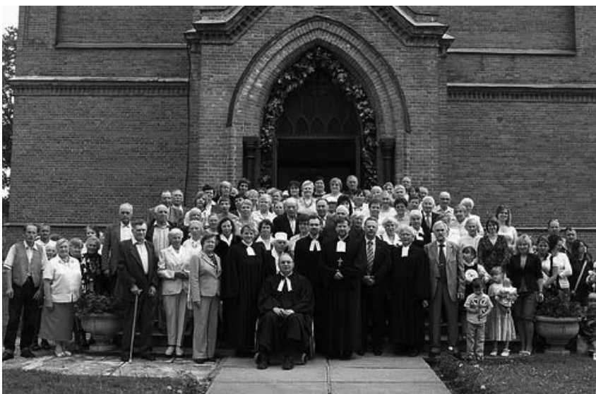
Lietuvos ev. reformatų Bažnyčios Sinodo dalyviai. Biržai, 07 06 24

■ Birželio 23–24 d. Biržuose vyko Lietuvos ev. reformatų Bažnyčios Sinodas, dalyvavo dvasininkai, Sinodo kuratoriai ir delegatai ar atstovai iš Biržų, Nemunėlio Radviliškio, Papilio (visos – Biržų r.), Salamiesčio (Kupiškio r.), Švobiškio (Pasvalio r.), Kėdainių, Panevėžio, Klaipėdos, Šiaulių ir Vilniaus ev. reformatų parapijų.