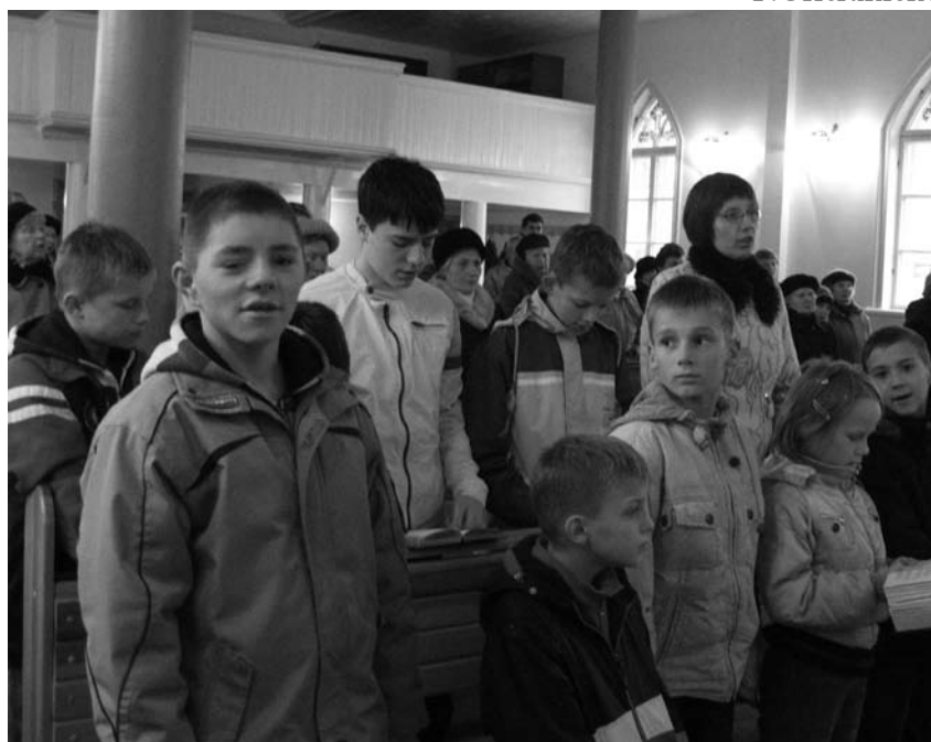
Medeikių „Vaiko užuovėjos“ vaikai pamaldose Panevėžyje