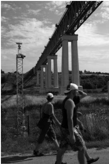
Didžiausias Lietuvoje Lyduvėnų geležinkelio tiltas

Kelionės metu pamatytas didžiausias Lietuvoje Lyduvėnų geležinkelio tiltas, kuris Vyriausybės nutarimu šių metų pavasarį paskelbtas kultūros paminklu. Tiltas ilgis – 599 metrai, aukštis ties Dubysos upe 42 metrai. Išklausė labai įdomios tilto istorijos, kurią įvairiose bibliotekose surinko žurnalistė Aurelija Arlauskienė, pavaikščioję tilto papėdėje bei nusifotografavę sukome Šiluvos link.