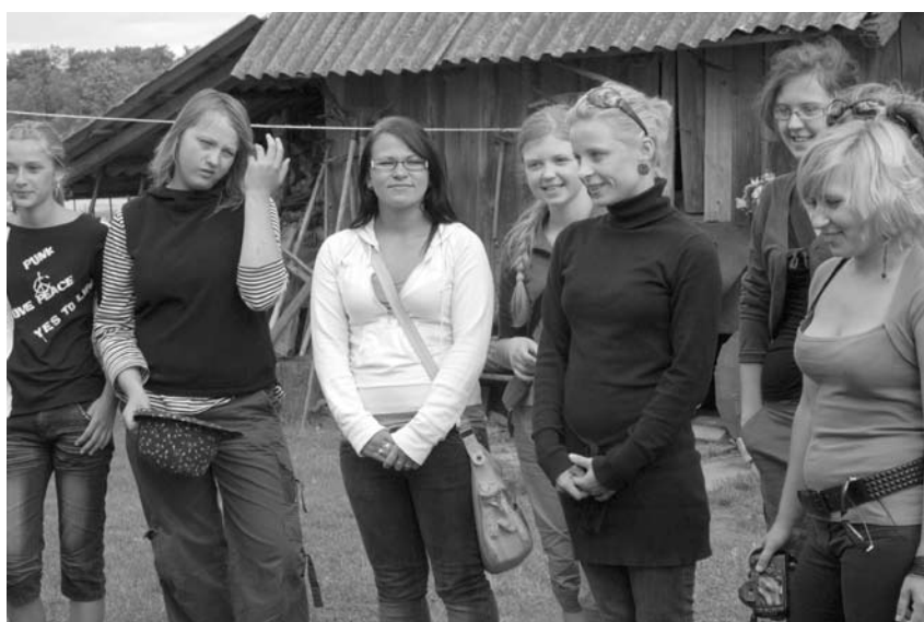
Buvo šaunu susitikti su draugais