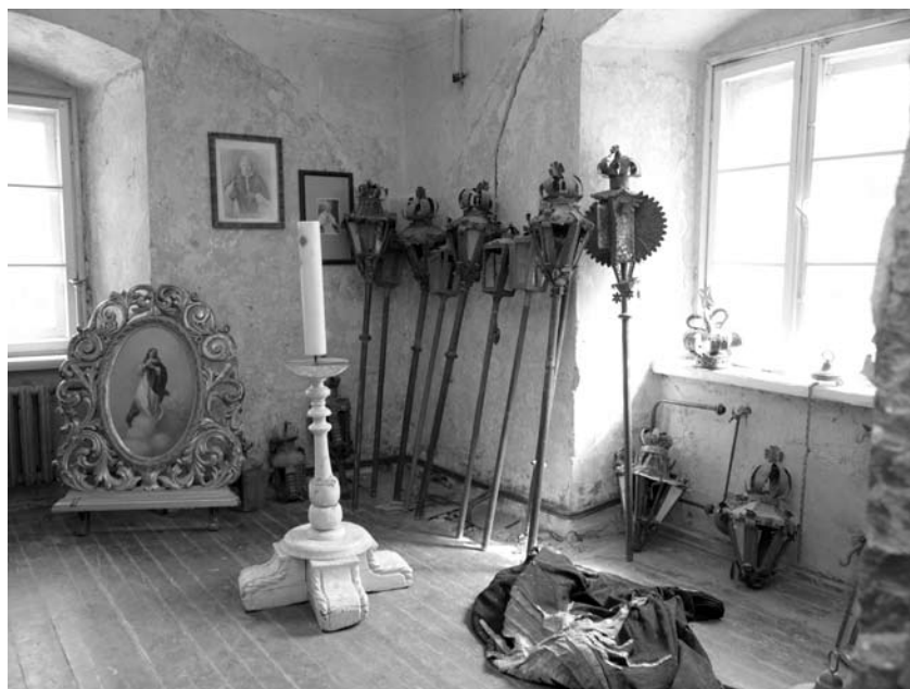
Unikalūs eksponatai Tytuvėnų vienuolyne

Apžiūrėję Kelmės dvare įsikūrusį vienintelį Lietuvoje Indėnų muziejų, pasėdėję vigvame ir atidžiai akimis patyrinėję muziejaus eksponatus (ypač visiems patiko sapnų gaudyklės), skubėjome į 1615 metais reformato Jurgio