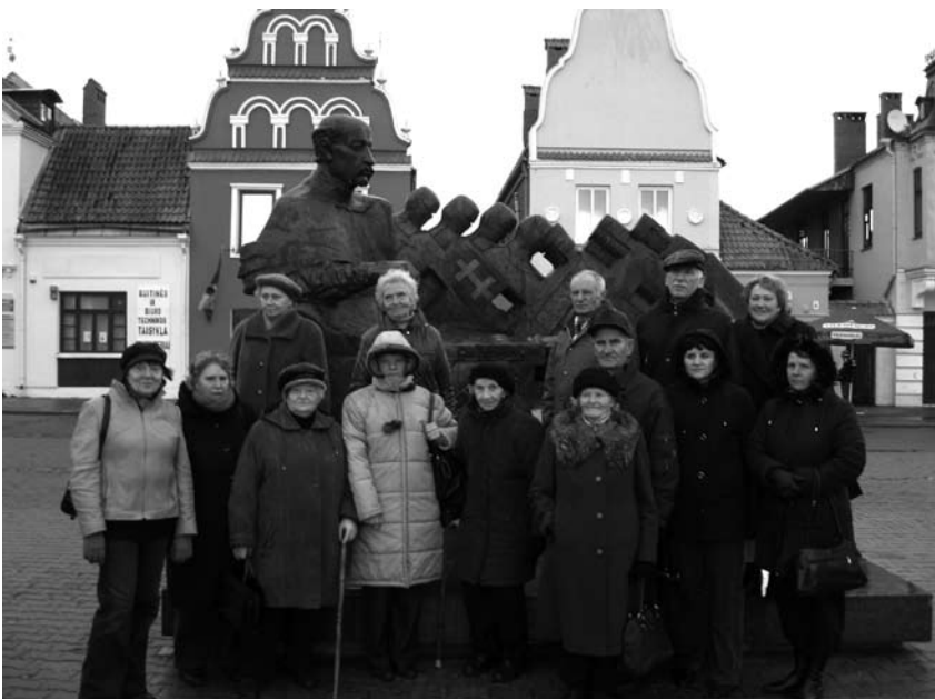
Panevėžiečiai prie paminklo Jonušiui Radvilai