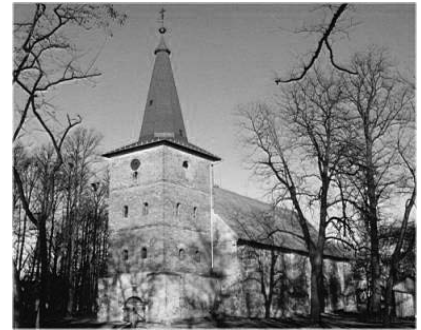
Ev. liuteronų bažnyčia Rusnėje – viena seniausių Lietuvoje