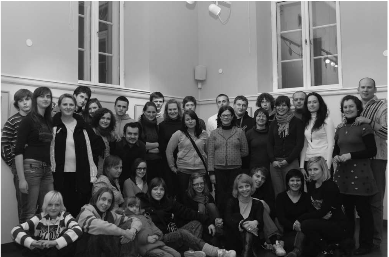
Po konferencijos „Radvilos“ jaunimas.