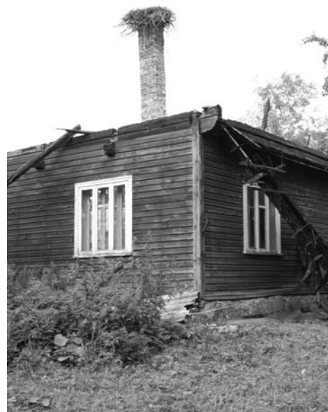
Sudegusi Yčų sodyba Šimpeliškiuose