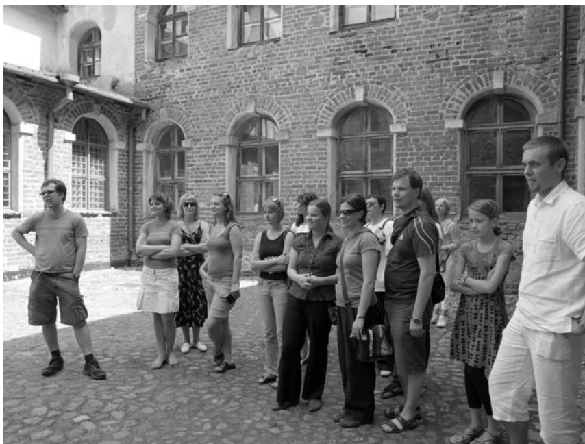
Giesmė Tytuvėnų vienuolyno kieme