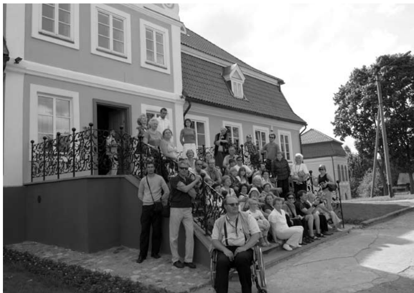
Prie Kelmės dvaro.