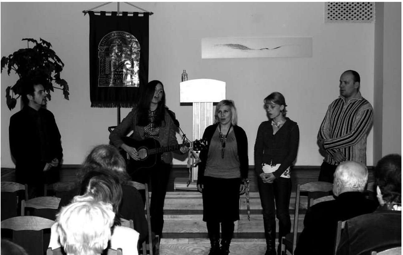
Radvilėnai dainuoja Vilniaus mokytojų namuose.