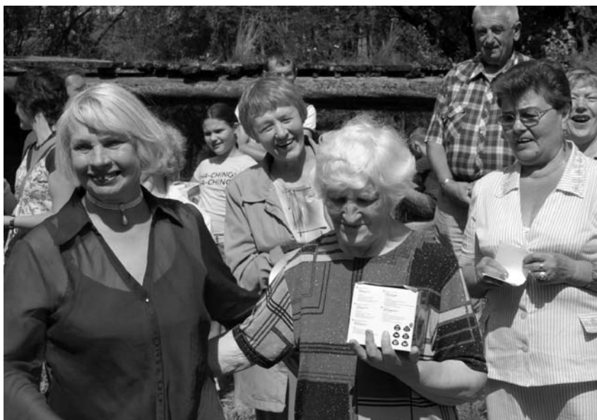
Pagerbti Šimpeliškių kaimo senbuviai

ev. reformatų Bažnyčios sinodus Biržuose.