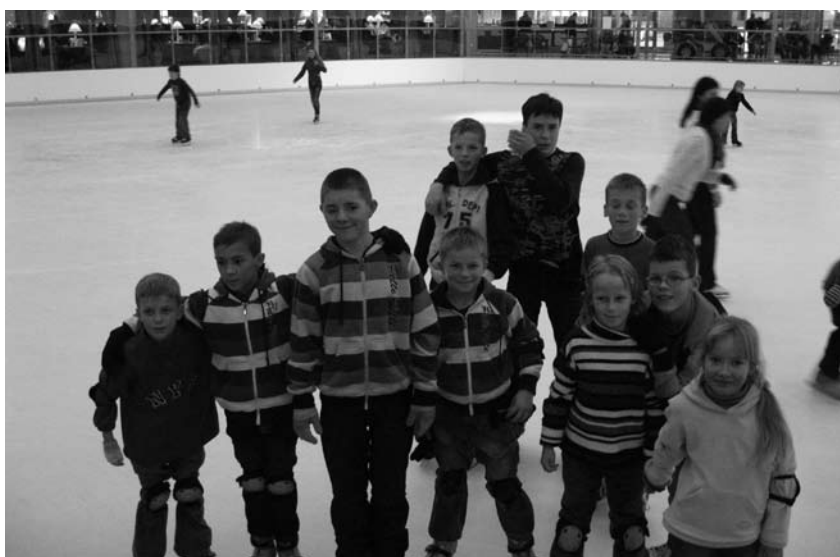
Medeikiečiai „Babilono“ ledo arenoje

nori dėmesio. Jie noriai atsiveria, žingeidūs, diskutuoja, džiaugiasi dėl niekučių.