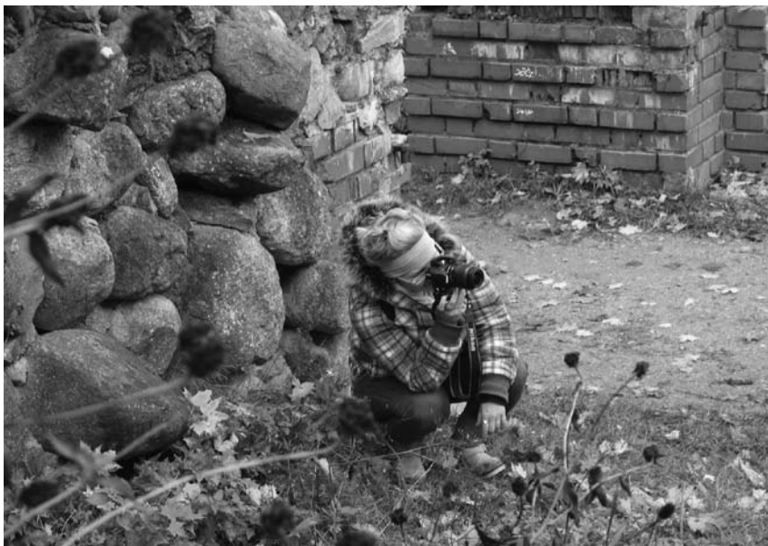
Sunkios gero kadro paieškos ...