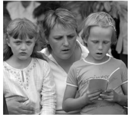
Giesmės šildė širdes