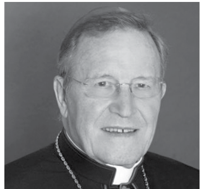
Popiežiškosios krikščionių vienybės tarybos pirmininkas kardinolas Walter Kasper