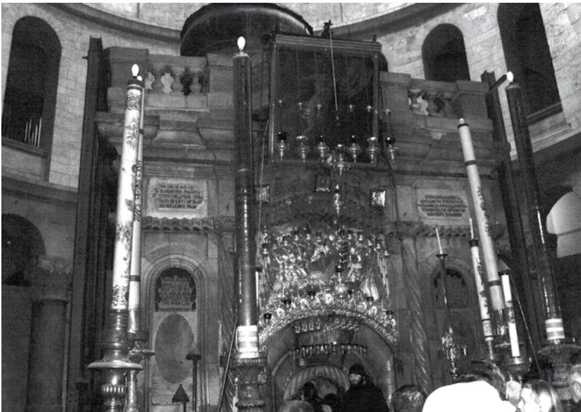
Jėzaus kapo koplyčia

Priėjimas prie sienos yra padalintas į dvi dalis: vyriškąją ir moteriškąją. Prie jos galima prieiti tik apsigobus galvą skraiste ar koku kitu galvos apdangalu. Įprastai žmonės į Raudų sienos plyšius įkiša raštelius su norais. Tikima, kad norai vėliau išsipildo. Nepalikau jokio raštelio, nors jų ten šimtai. Man užteko minutėlę pridėti ranką prie Raudų sienos.