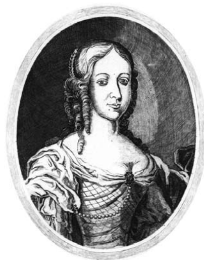
Liudvika Karolina Radvilaitė (1667–1695) – LDK kunigaikštystė

spaustuvei, reformatų spaustuvių LDK teritorijoje neliko. Pakartotinis knygos kontrafaktinis leidimas (t.y. nurodant I leidimo datą ir spaustuve) išėjo Karaliaučiuje 1684 m. kunigaikštystės Karolinos Liudvikos Radvilaitės (1667–1695 m.) lėšomis. Tuometinėje Lietuvos reformatų Bažnyčioje jau buvo pasirodę pranešimų, kad trūksta lietuviškų knygų. Vadinasi, šios knygos tiražas jau buvo pabaigtas ir pritrūko lietuviškų maldynų bei giesmynų. Lietuvoje jau buvo išgalėjusi katalikų cenzūra ir LDK šios knygos jau buvo neįmanoma išspausdinti. Reformatų Bažnyčia Lietuvoje tebegyveno, bet šalyje nuo 1569 m. šitvirtino jėzuitai, kurie XVII a. antroje pusėje jau buvo pasiekę akivaizdžią pergalę. Reformatams visoje LDK reikėjo knygų, o ypač Radvilų valdose Biržuose, Kėdainiuose. Reformatų pozicijos LDK jau buvo gerokai susilpnėjusios, bijota skelbti tą faktą, kad iš naujo leidžiamos reformatų knygos, todėl ir buvo spausdinamas šis kontrafaktinis leidinys. Taip norė-