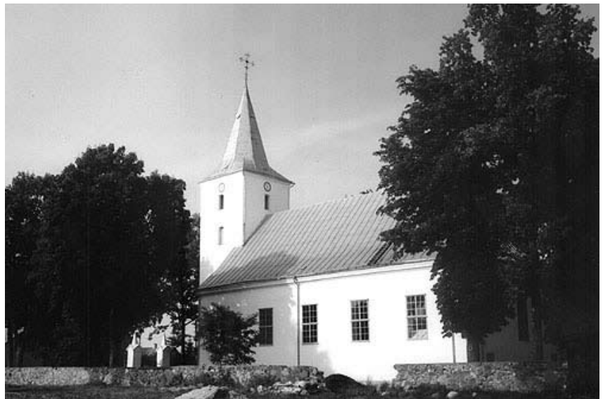
Papilio evangelikų reformatų bažnyčia. 2002

Bažnyčios visuma susideda iš daugybės atskirų dalių. Tasai kūnas turi daugybę sąnarių: tai esame mes! Kokiomis gi sąlygomis priklausome mes – paskiros asmenybės tai visumai? Mes priklausome Evangelikų Bažnyčiai, nes gimėme iš evangelikų tėvų. Ir kas vadinasi evangeliku, tas, ar jis dalyvauja ar ne bažnytiniame gyvenime, paprastai jau ir laikomas jos nariu, gali naudotis jos patarnavimais, gali dalyvauti Šv. Vakarieneje ir Dievo žodžio klausymėsi. Tasai mūsų Bažnyčios atviraširdiškumas yra sykiu ir jos jėga, ir jos silpnybė. Jos silpnybė, nes jinai turi skaitytis su daugeliu savo narių, kurie krikščionys ir protestantai vien tik iš vardo. Ir jos jėga, nes jinai tuo išvengia pagundos pasidaryti teisėju, ir kad gali sprendimą ir rūšiavimą perleisti Tam, kuris mato ne tik tai, kas yra prieš akis, bet kuris ištiria žmogaus širdį ir vidų.