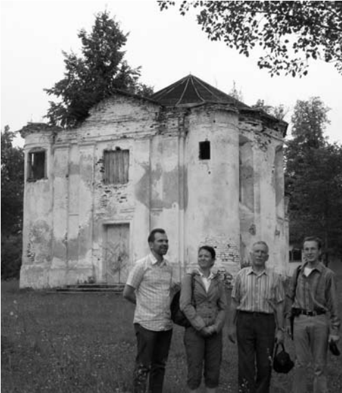
Prie Kuchtičų reformatų bažnyčios griuvėsių