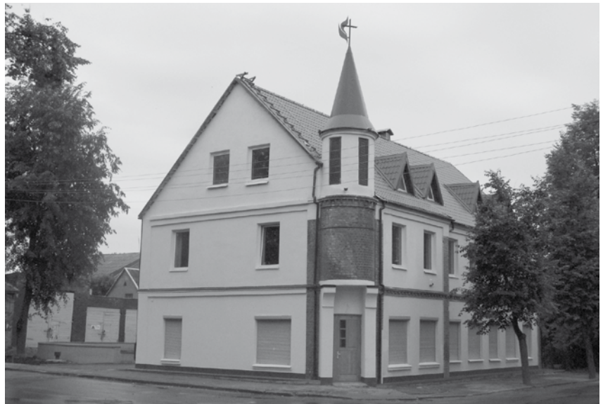
Nuotraukoje: Jungtinės metodistų Bažnyčios maldos namai Biržuose

„Nepaisant egzistuojančių skirtumų ir išankstinių nuostatų (dažniausiai dėl nežinojimo), mes galime pasisemti išminties vieni iš kitų ir sustiprinti savo tikėjimą. Nuostabu, kai tiek pasišventę evangelikai, tiek nuoširdūs katalikai, nors ir turėdami skirtingą požiūrį į sakramentus, priklausydami skirtingoms Bažnyčios tradicijoms, ne tik eina Išganymo keliu, bet kaip Kristaus kūnas yra dar vienas Dievo malonės sakramentas šiame pasaulyje“.