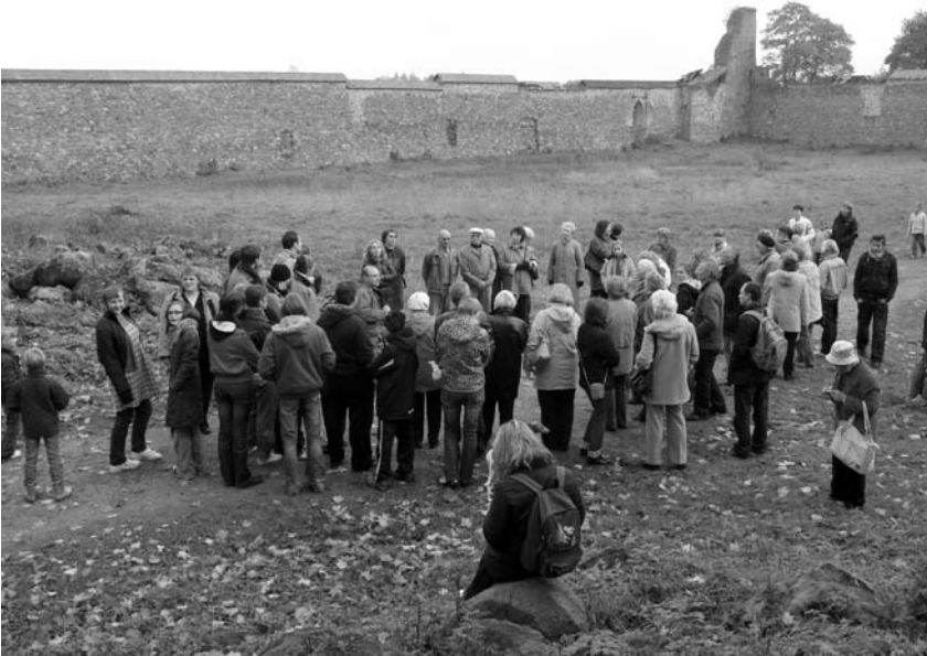
Medininkų pilies kieme

Sužavėti buvusios didybės ir įtaigaus pasakojimo nei jauni, nei vyresni renginio dalyviai nenorėjo skirstytis, tačiau pradėjęs krapnoti lietutis ginė į automobilius. Pakeičiui į Buikų kaimą, kuris yra šalia nuostabių Merkio kilpų, buvo aplankyta sena Vilkiškių dvarvietė. Čia tebestovi prieš 161 metus statyti Domochovskių mediniai dvaro rūmai, kuriuos puošia grakščios medinės kolonos. Gaila, jog šis statinys – vienas iš nedaugelio