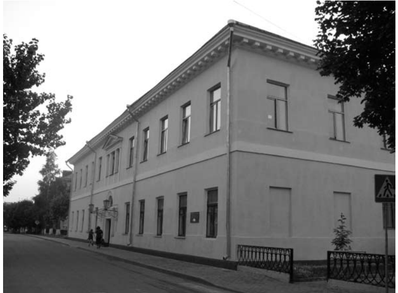
Slucko reformatų gimnazija

Kėdainių gimnazijas, ilgą laiką mokėsi daugelis gambiausių jaunųjų reformatų.