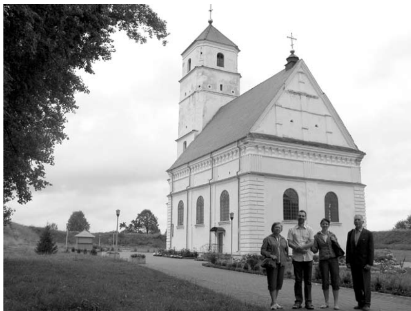
Prie Zaslavljo bažnyčios

Bažnyčia yra didiko Jono Glebavičiaus fundacija. Reformatų bažnyčios pastatas išlikęs iki šių dienų, tačiau juo šiuo metu naudojasi stačiatikiai ir ji dabar vadinama Preobraženskajos cerkve. Pastato forma ir architektūra labai primena reformatų bažnyčias Lietuvoje ir, jeigu ne stačiatikių kryžius ant 35 metrų aukščio bokšto, iš šalies būtų sunku pasakyti, jog tai cerkvė. Aplink bažnyčią supiltas pylimas – labai primenantis Biržų tvirto-