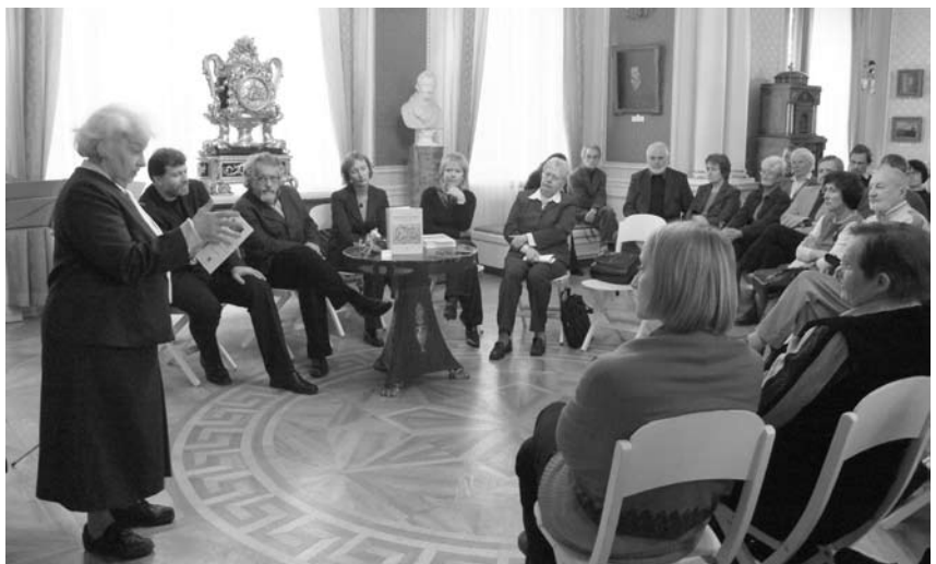
Monografijos „Maištininkų katedros. Ankstyvoji reformacija ir lietuvių-italų evangelikų ryšiai“ pristatymas