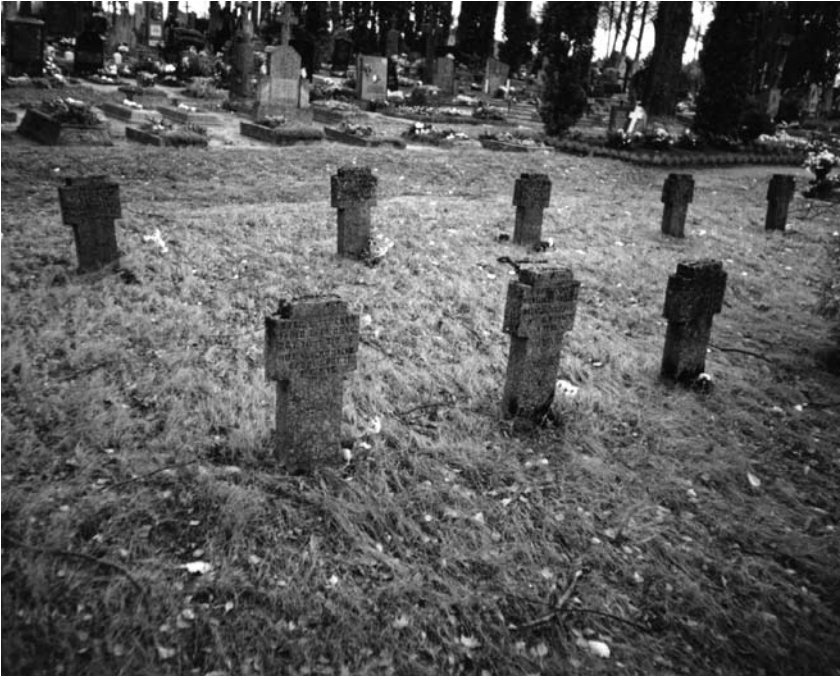
Pirmajame pasauliniame kare žuvusiųjų karių kapai Pabiržės kapinėse