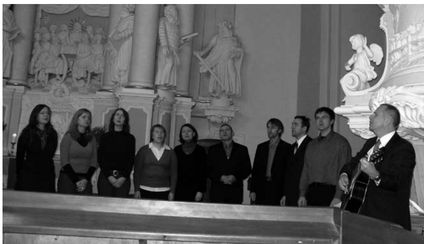
Gieda Vilniaus bažnyčios „Tikėjimo žodis“ choristų grupė