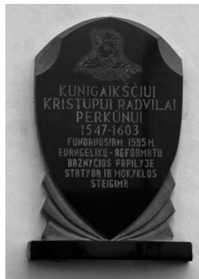
Paminklinė lenta Kristupui Radvilai Perkūnui (1547 – 1603) ant Papilio bažnyčios sienos

Salose Radvilos ilgam neapsistodavo, jų pagrindinė rezidencija nuo XVI a. buvo Biržai ir Papilys. 1541 m. Mikalojus Radvila Rudasis kartu su kitomis Biržų žemėmis paveldėjo ir Papilį. 1568 m. Papilį kaip vestuvinę dovaną gauna jo sūnus Kristupas Radvila, dėl savo būdo pramintas Perkūnu. Jis Lietuvos Didžiojoje Kunigaikštystėje ėjo labai aukštas pareigas: riekinininko (1566), taurinininko (1569), lauko etmono (1572), Trakų kašteliono ir pakanclerio (1579), Vilniaus