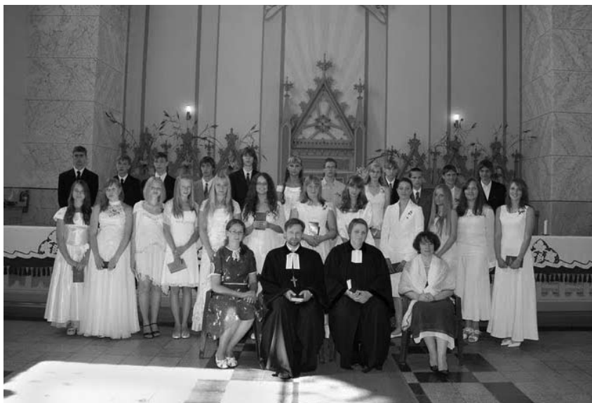
Konfirmitai Biržų reformatų bažnyčioje

Šventė buvo tikrai graži, šventiška, iškilminga, apie kurią primins daugybė videoįrašų, nuotraukų, bet svarbiausia ta, kurioje konfirmitai su kunigais ir vargonininkėmis įamžinti bažnyčioje – mūsų Biržų reformatų bažnyčioje prie Dievo stalo!