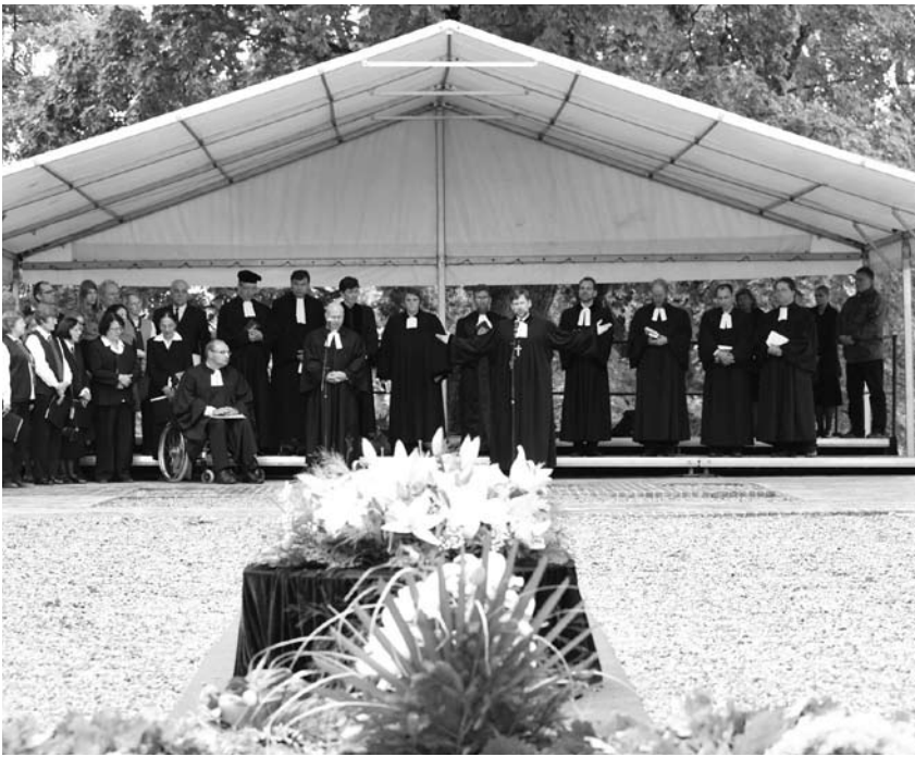
Palaiminimas po Radvilų palaikų perlaidojimo reformatiškų pamaldų

pastato vaizdų. Lietuvos TSR kultūros paminklų apsaugos įstaiga davė leidimą, ir 1965 m. tuoj po Naujųjų metų senoji koplyčia buvo susprogdinta.