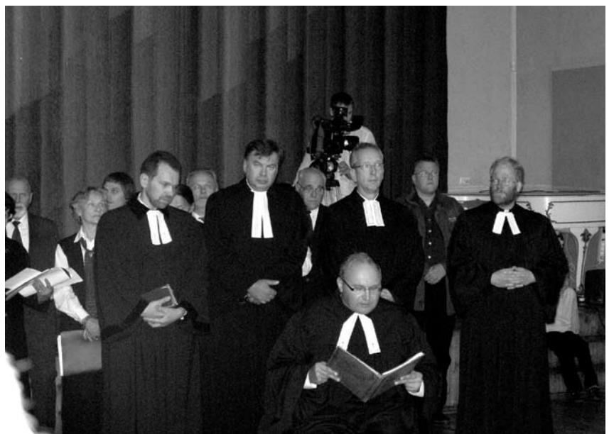
Apsėdus laikė Vilniaus ev. reformatų kunigai ir svečiai

jama Lietuvos dalis. Tai, kad jie, aršūs kalvinistai, XVI amžiuje ėjo aukščiausias pareigas katalikiškoje valstybėje, liudija tos valstybės toleranciją (neįprastą to meto Europoje). Tai, kad Radvilos atkakliai gynė Lietuvos interesus (taip pat ir sudarant Liublino uniją), turėtų praplėsti mūsų patriotizmo, o gal ir pačios lietuvių tautos sampratą. Naudodamiesi gausiomis gėrybėmis pagal to laiko standartus jie nejautė nevisavertiškumo komplekso bendraudami su ryškiausiais to meto Europos didžiūnais ir natūraliai perimdavo naujausias to meto idėjas. Šito palinkėčiau ir šiandien mums visiems.