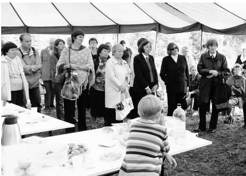
Agape po iškilnių

Protestantų koplyčia išstovėjo iki pat 1965 metų. Tada „Mosfilmas“ Vilniuje suko filmą apie karą „Kaip dabar jus vadinti“, ir jiems reikėjo griūvančio seno