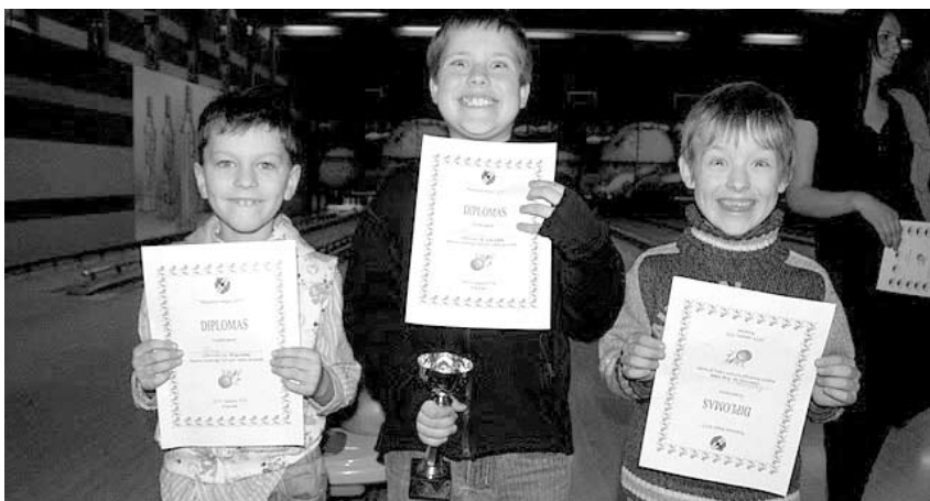
„Radvilos kėglis 2011“ jaunieji nugalėtojai