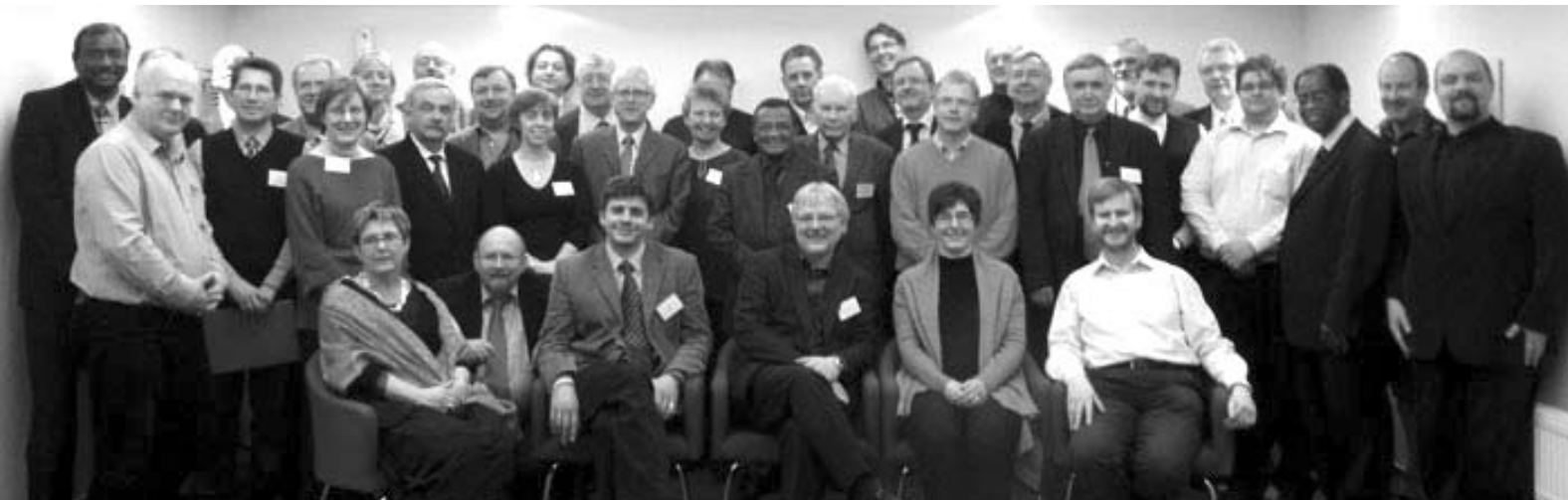
Europos reformatų Bažnyčių vadovų taryba. Praha.

Pasinaudota „Mūsų sparnai“ Nr.15, 1963 m. gruodis; Nr.18, 1965 m.