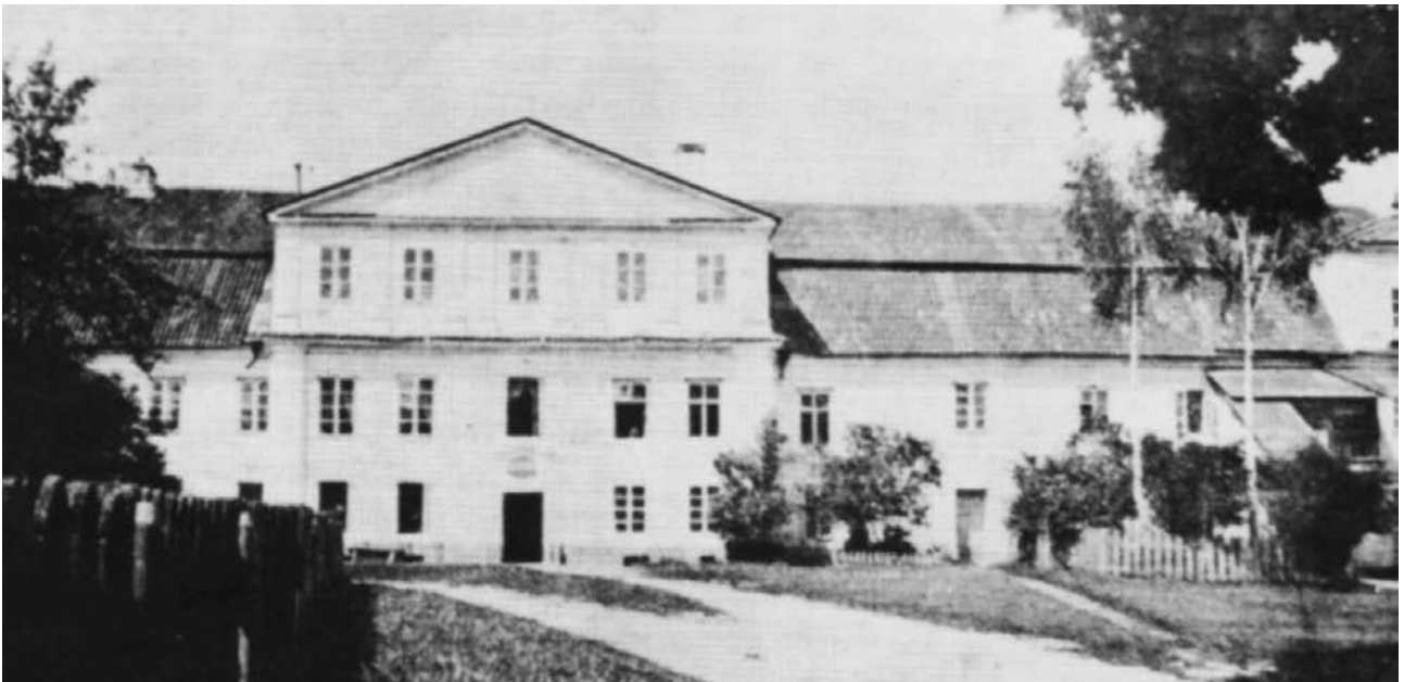
Sinodo rūmai Vilniuje, Pylimo 7, 1939 m.

Leidžiamas nuo 1998 m. lapkričio mėn. ISSN 2029-512X