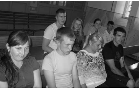
Naktiniai budėtojai iš Švobiškio