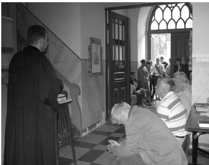
Pirmosios vigilijų pamaldos bažnyčios tarpduryje užsitęsios iki kitos dienos pusiaudienio...