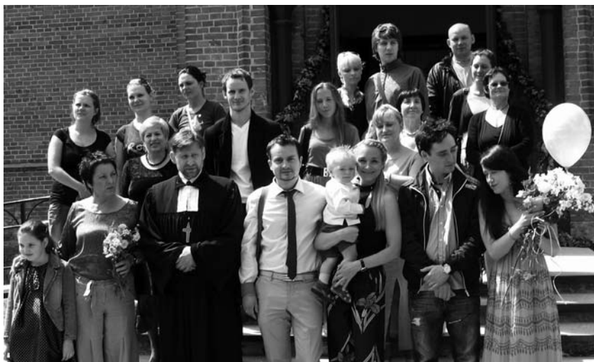
Po Margirio Šišlos Krikšto