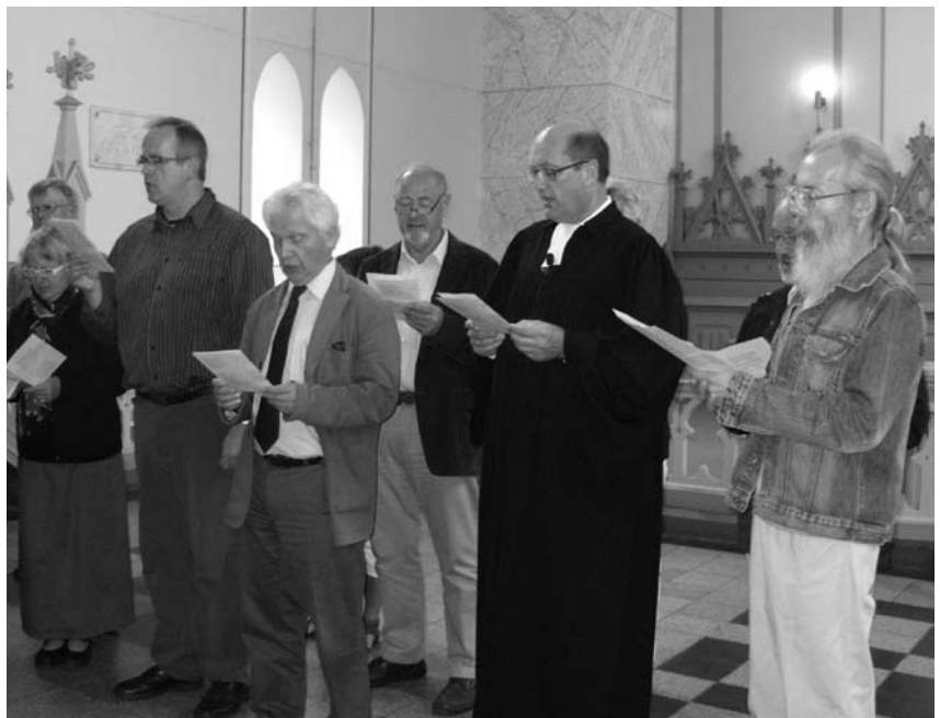
Svečiai iš Vokietijos gieda Biržų bažnyčioje.

Dvasininkas pradėjo nuo skaitinio iš Pakartoto Įstatymo knygos, priminė žodžius, kuriais Mozė kreipėsi į savo tautą.