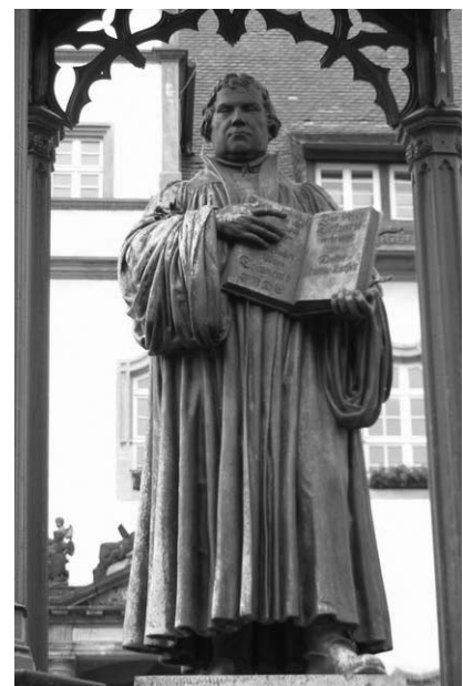
M. Liuterio paminklas Witenberge