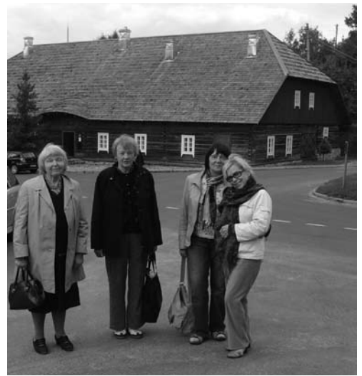
Panevėžietės prie buvusios Dubingių karčiamos