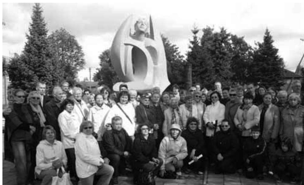
Keliauninkai prie Vabalninką puošiančios skulptūros „Svajonė“.