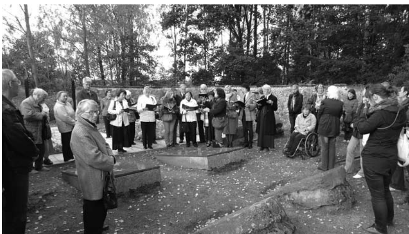
Reformatų choro „Giesmė“ giesmės Vilniaus universiteto mokslininkų kapinėse Jašiūnuose