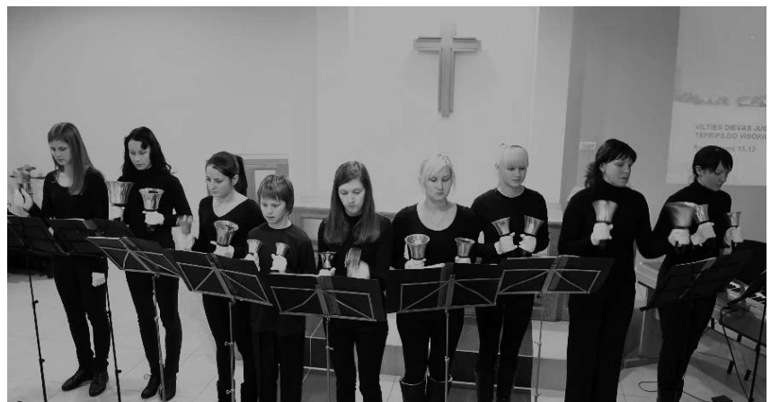
Biržų jungtinės metodistų bažnyčios varpelių ansamblis

Trečiosios pamaldos vyko Biržų Šv. Jono Krikštytojo R. katalikų bažnyčioje. Visi dvasininkai