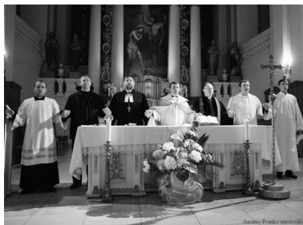
Pamaldos Biržų katalikų bažnyčioje nukelta į 4 p. ►