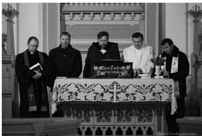
Pamaldos Biržų reformatų bažnyčioje