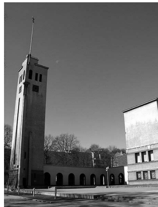
Kauno karo muziejus