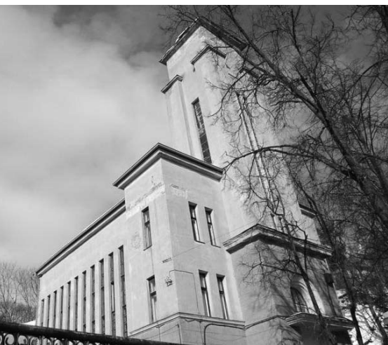
Kauno ev. reformatų bažnyčia

Latvijos sostinėje Rygoje vyks Baltijos šalių jaunimo festivalis. Festivalį organizuoja Billy Grahama evangelistinė asociacija (BGEA), bendradarbiaudama su Baltijos šalių Bažnyčiomis. Festivalyje tūkstančiai jaunuolių susirinks iš Lietuvos, Latvijos, Estijos ir galės džiaugtis jaunimui skirta muzikine programa. Rygos arenoje pamokslaus evangelistas Franklinas Grahamas. Nuo vasario mėnesio veikia Baltijos šalių jaunimo festivalio svetainė – www.byf2012.lv . Apsilankius joje galima daugiau sužinoti apie festivalį, jo programą, dalyvausiančius muzikantus, taip pat įsijungti į jaunimui skirtą veiklą.