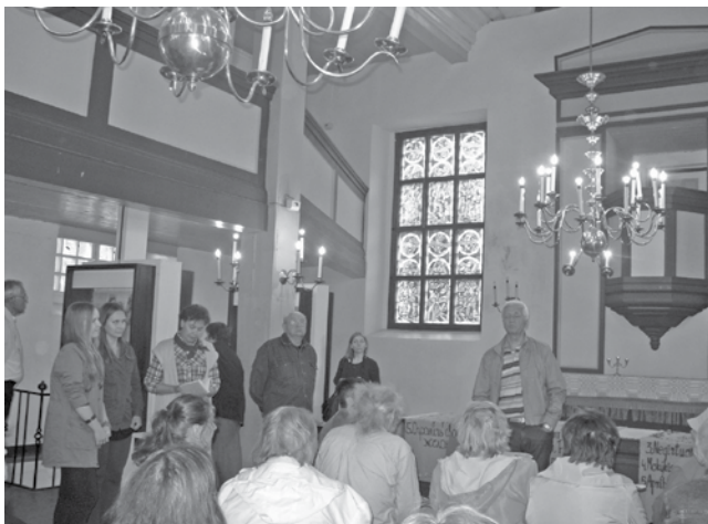
Tolminkiemio bažnyčioje – K. Donelaičio muziejuje