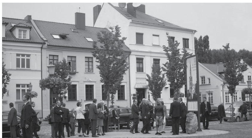
Joachimas Gauckas prie akmens, žyminčio vietą, kurioje stovėjo Šv. Jono bažnyčia.