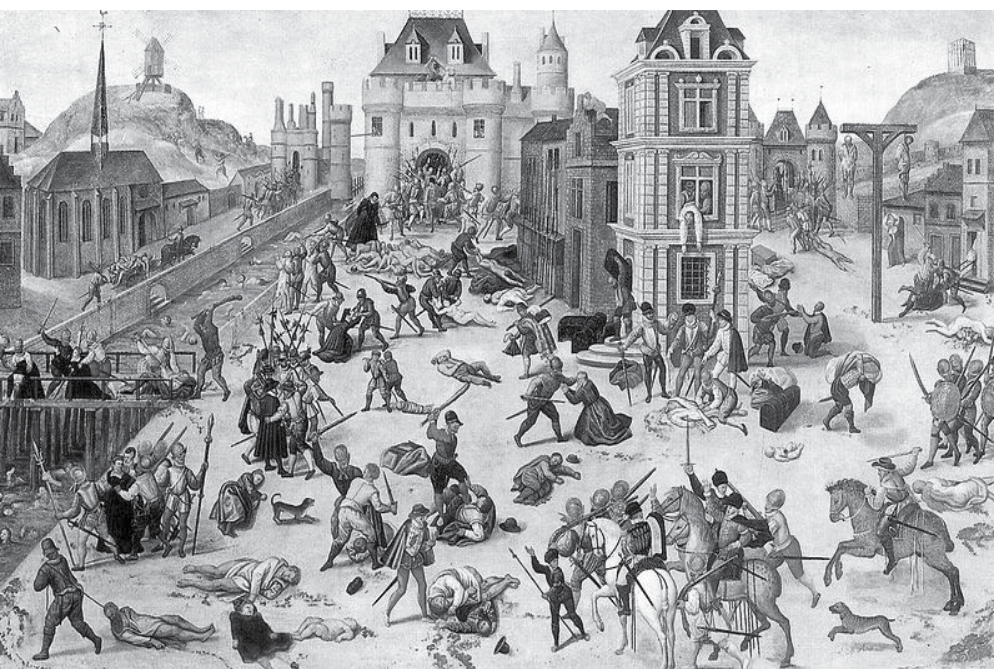
François Dubois paveikslas, vaizduojantis susidorojimą su hugenotais, XIX a.

Parengta pagal straipsnius internetinėse svetainėse