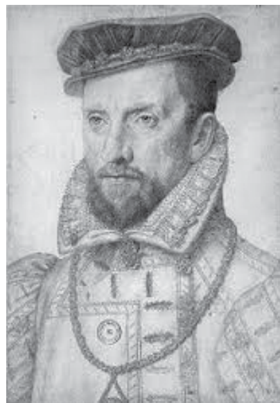
Admirolas Gasparas de Kolinji ( Gaspard de Coligny ).

noto Henriko Navariečio (Burbono) vedybas, į kurias suvažiavo daug turtingų ir žymių hugenotų. Skerdynės prasidėjo rugpjūčio 24-ios naktį, admiralą Gasparą de Kolinji apie 3 val. nakties išmetus pro langą ir pradėjus kitų hugenotų, buvusių Paryžiuje, žudynes. Per šią naktį ir sekančias dienas Paryžiuje buvo nužudyta apie 10000 žmonių. Po Baltramiejaus nakties nuo rugpjūčio iki spalio panašios hugenotų žudynės vyko ir kituose Prancūzijos miestuose: Tulūzoje, Bordo, Lione, Orleane. Baltramiejaus nakties žudynių žiaurumas buvo nenusakomas. Žudynės palietė ne tik hugenotų ideologus, bet ir nuosaikius bei tik prijautusius hugenotams. Gizų parankiniai išsiskyrė iš minios užsirišę ant rankovių baltus raiščius. Pirmiausia buvo stengiamasi susidoroti su senjorais. Po jų ateidavo eilė kitiems šeimos nariams, tarnams. Kartais buvo nužudomi ir atsitiktiniai praeiviai. Kartais žudy-