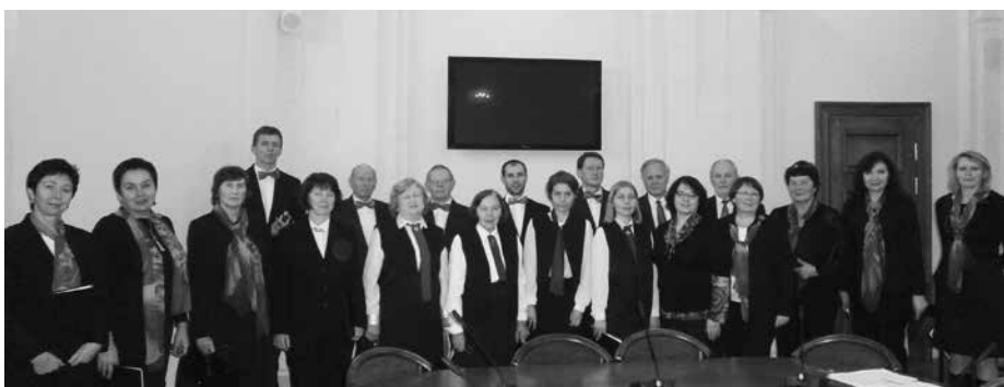
Jungtinis choras Mokslų akademijoje