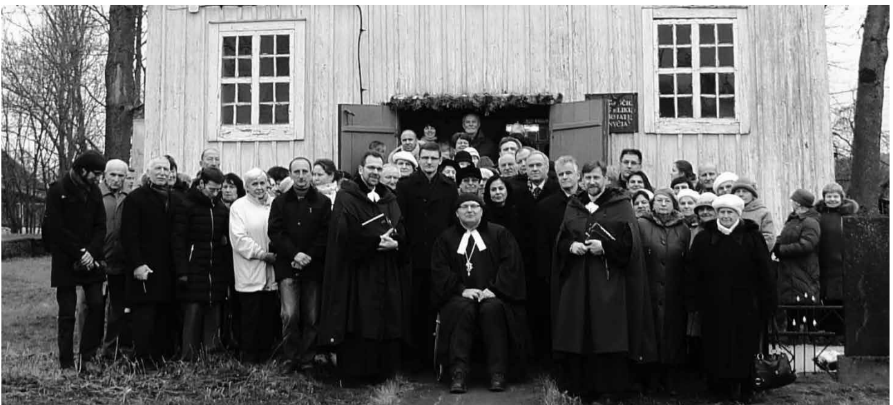
Prie Salamiesčio ev. reformatų bažnyčios