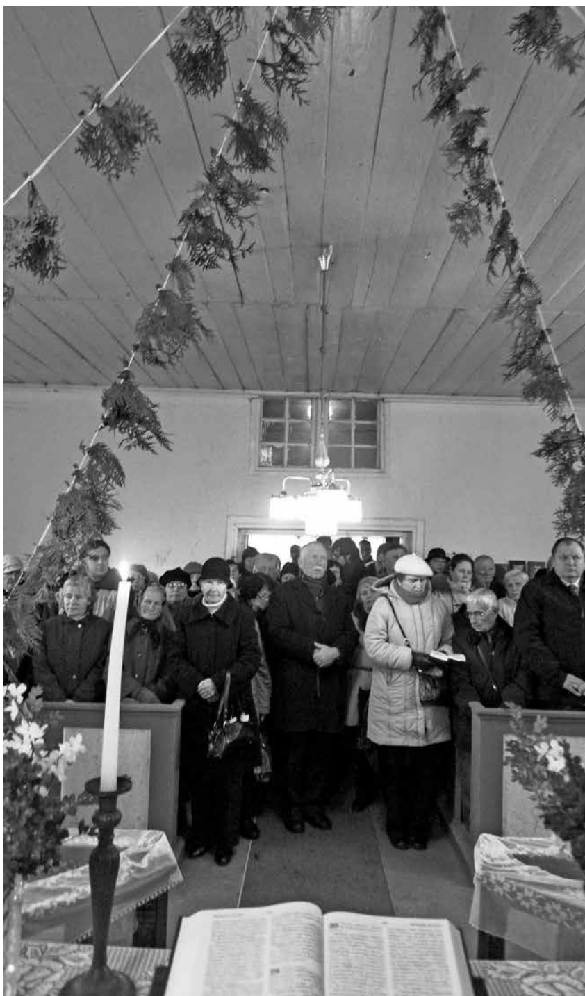
Parapijiečiai ir svečiai iškilmingų pamaldų metu