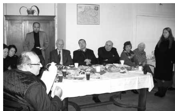
Agapė Parapijos namuose.